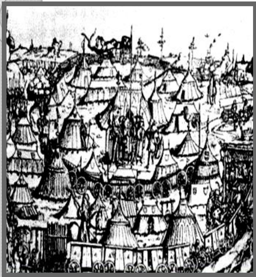
Лагерь таборитов. Гравюра XV в.

Чехия устала от многолетних войн. Первыми сдались умеренные. В 1434 г. у г. Липаны умеренные атаковали таборитов и выманив их из-за возов, разгромили. После были рассеяны и отдельные отряды.