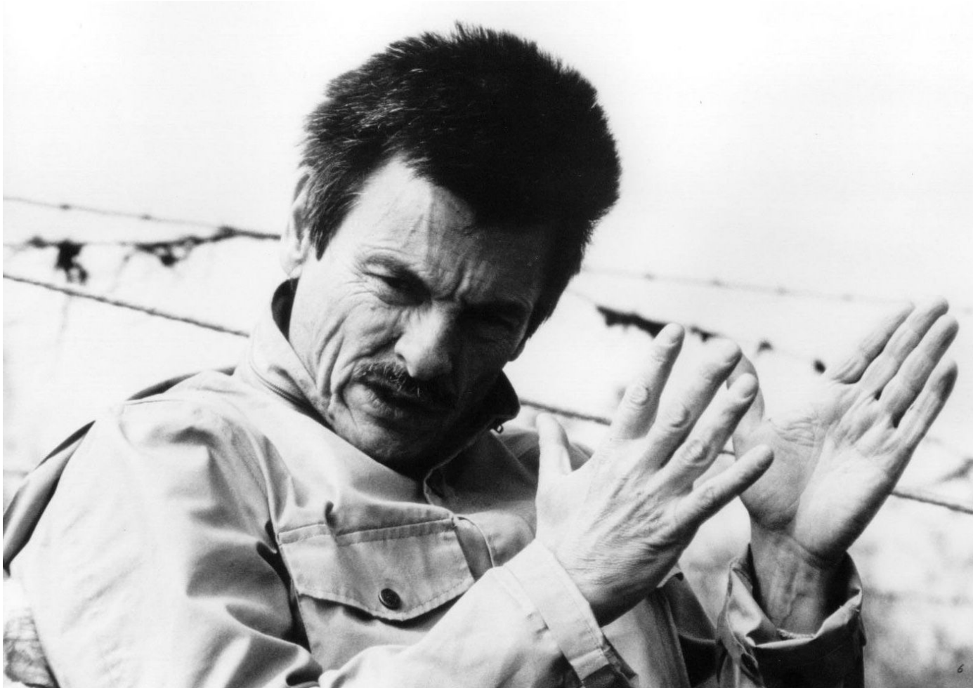
Режиссер Андрей Тарковский