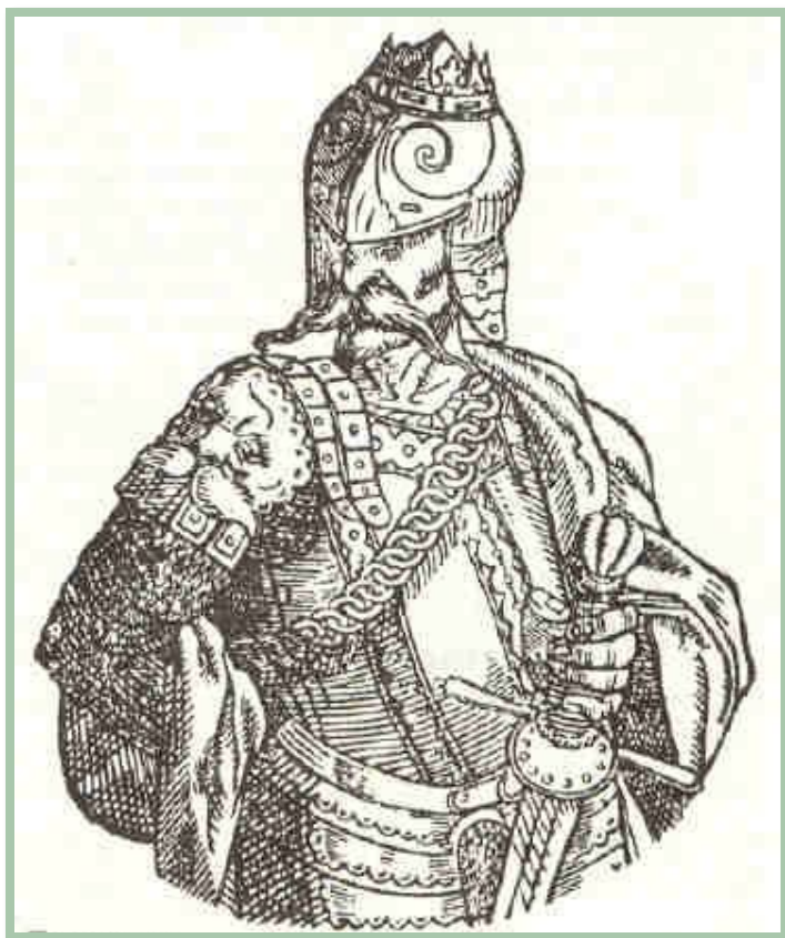
Князь Гедимин. С изображения XV в.

Гедимин - основатель династии Гедиминовичей. Великий князь литовский с 1316 по 1341 год.