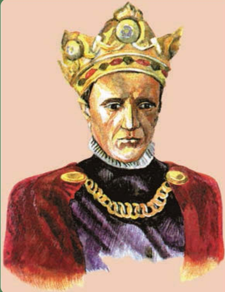
Великий князь Ягайло

В 1385 г. была заключена Кревская уния Литвы с Польшей. Великий князь литовский Ягайло принял католичество и, женившись на наследнице престола Польши Ядвиге, стал одновременно и польским королем.