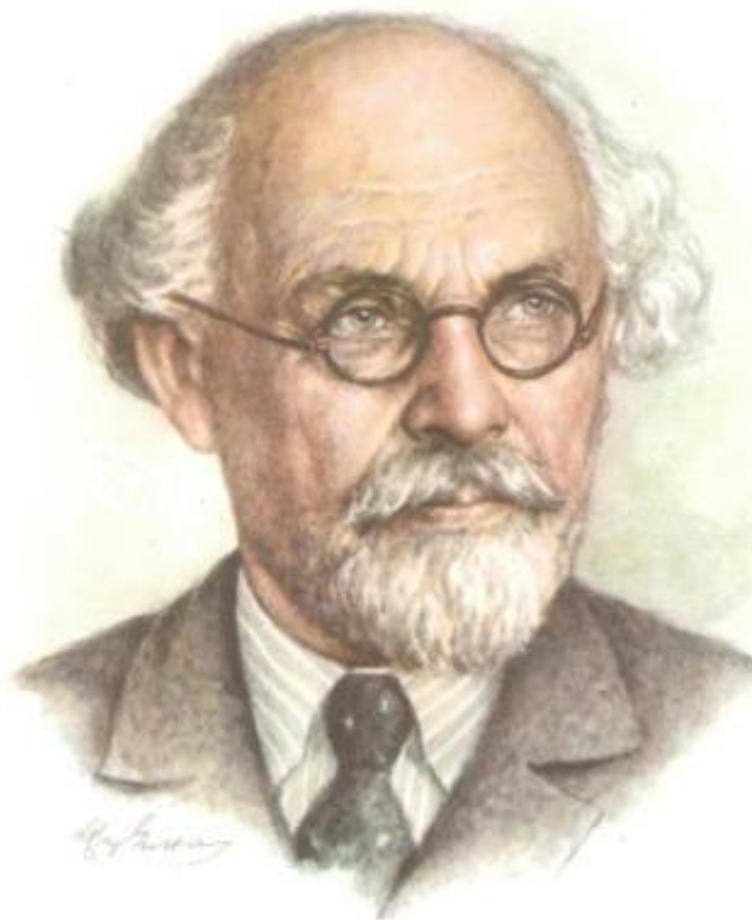
Михаил Михайлович Пришвин (1873—1954)