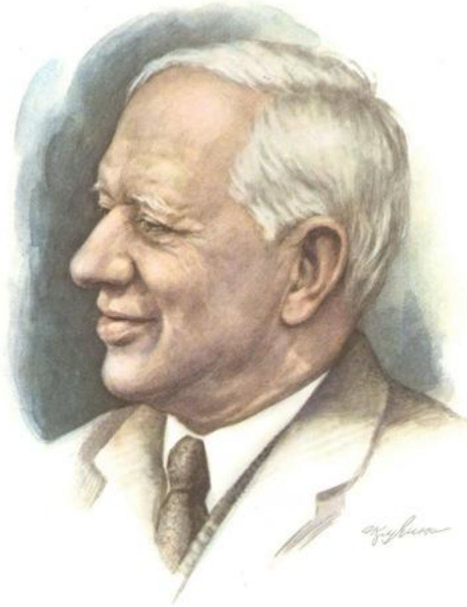
Корней Иванович Чуковский (1882—1969)