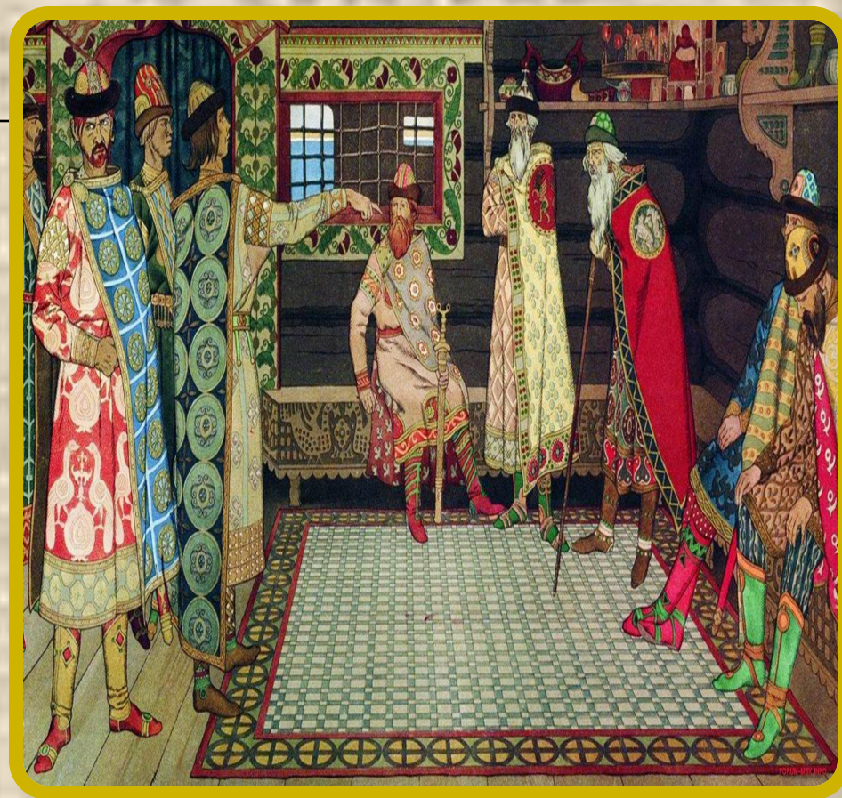
Картина "Княжеский съезд" - Иван Билибин