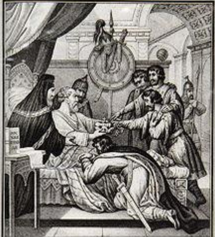
НАСТАВЛЕНИЕ ЯРОСЛАВА СЫНОВЬЯМЪ 1054

Вот я покидаю мир этот, сыновья мои. Имейте любовь между собой, потому что все вы братья... Если будете в ненависти жить, в распрях и ссорах, то погибнете сами и погубите землю отцов своих и дедов своих, которые добыли ее трудом своим великим...”