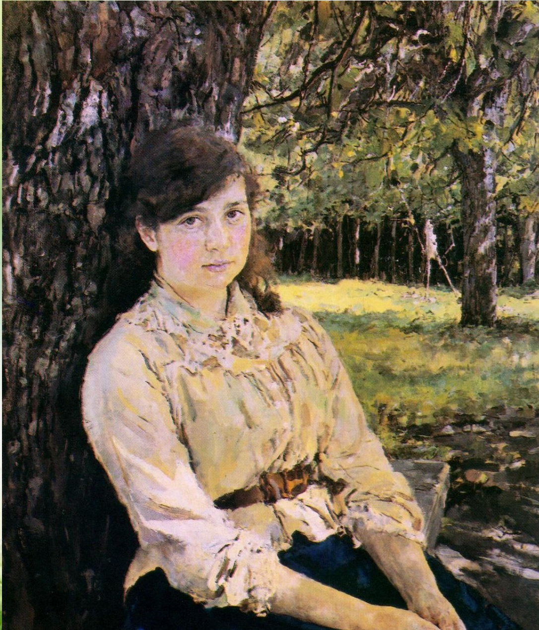
«Девушка освещенная солнцем»