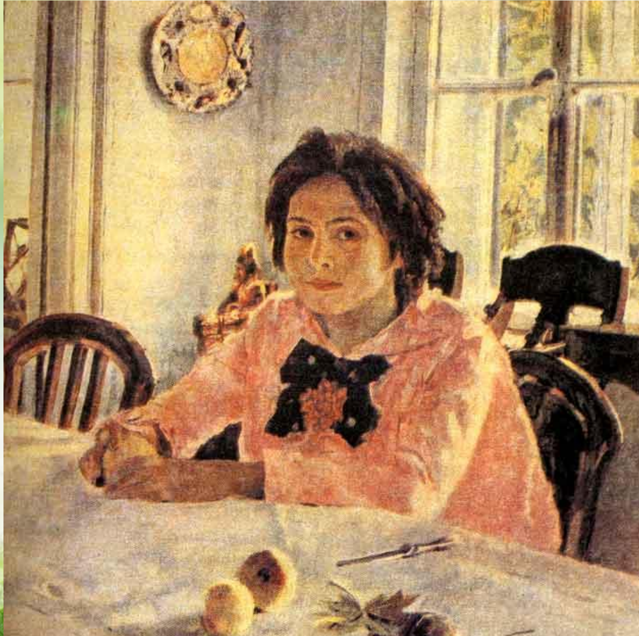
«Девочка с персиками»