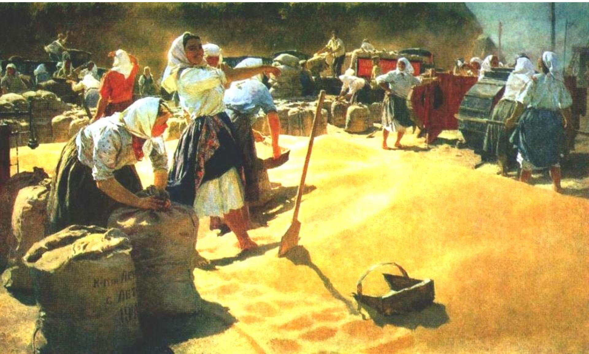
Т.Н. Яблонская (1917 – 2005). Хлеб. 1949 г. ГТГ