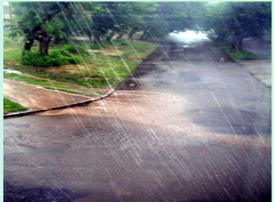
Косой дождь (косохлёт)