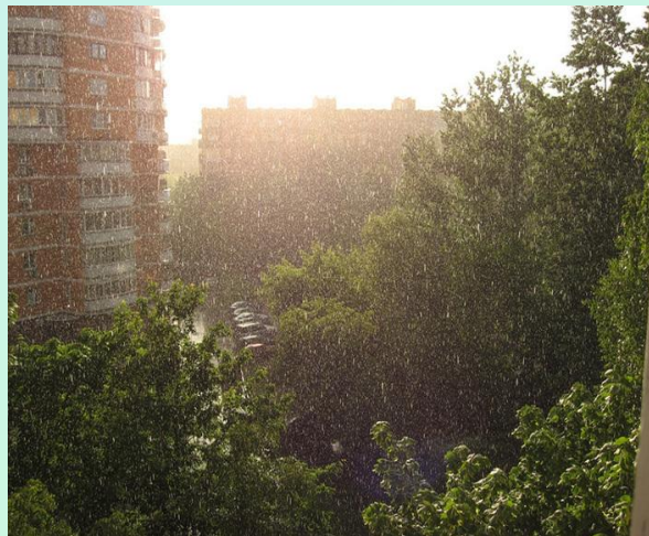
Ситничек – мелкий дождь, как из сита.