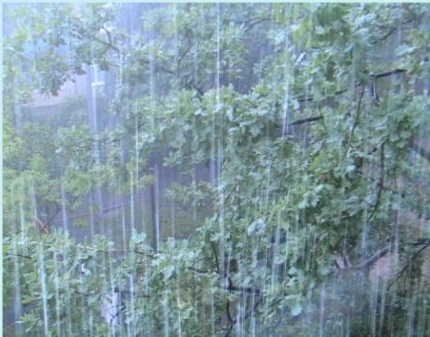
Ливень - проливной дождь.