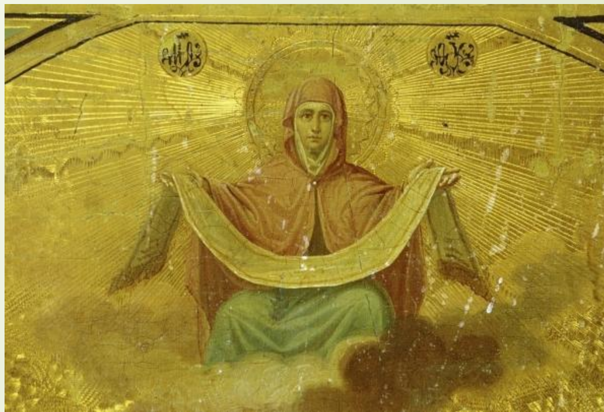
Репродукция иконы «Покров Богоматери» (XV век)

Даже в современном мире многие продолжают верить в приметы и следуют традициям, ходят в церковь и молятся святым. Тем самым они очищают свое сердце и душу и открываются перед Богом.