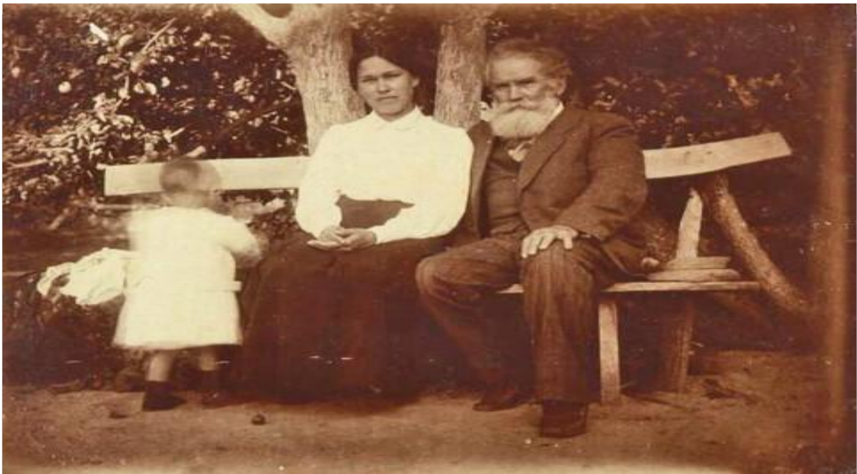
Короленко с дочерью и внучкой