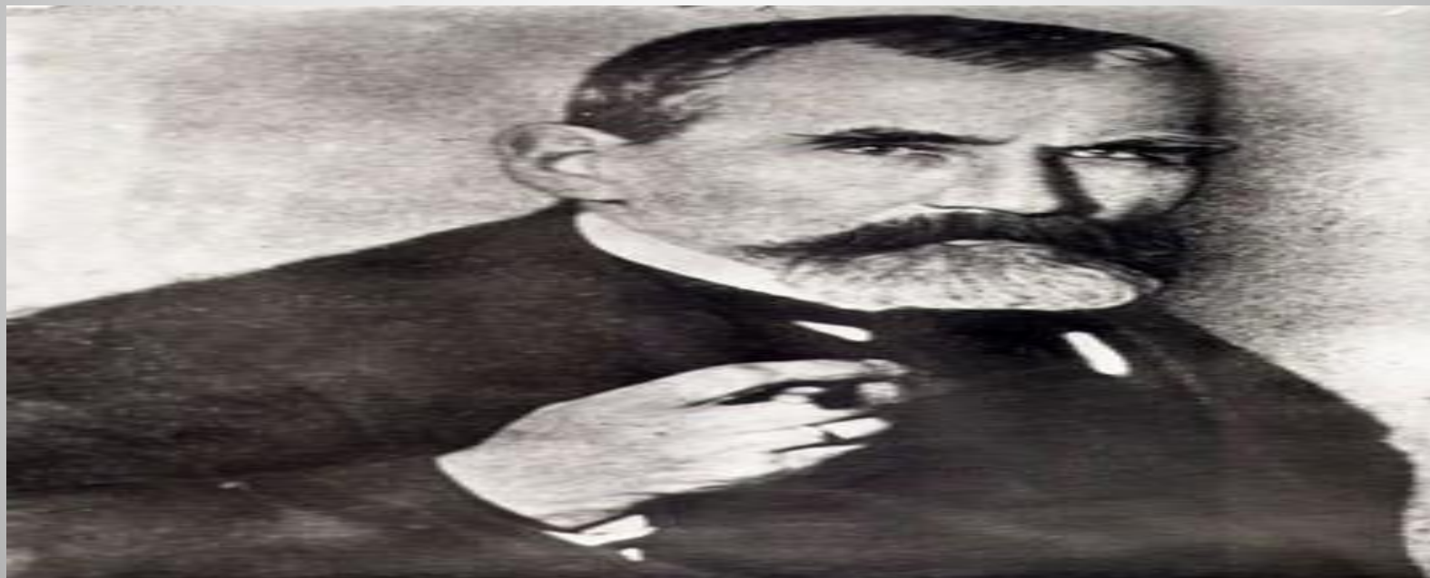
Эдуард Карлович Пекарский