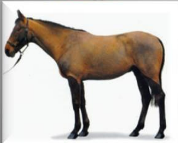
Кабардинская порода лошадей