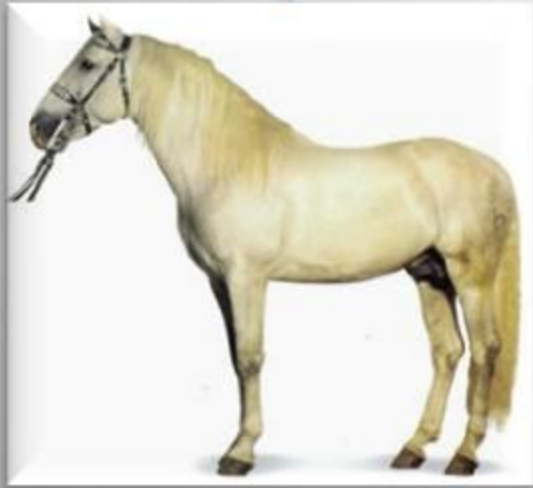
Андалузская порода лошадей