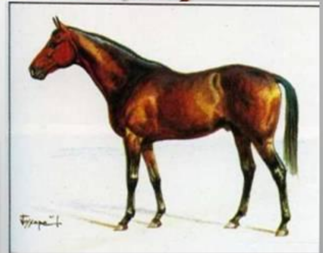
Чистокровная верховая порода