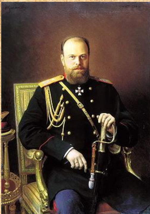
отец: Александр III