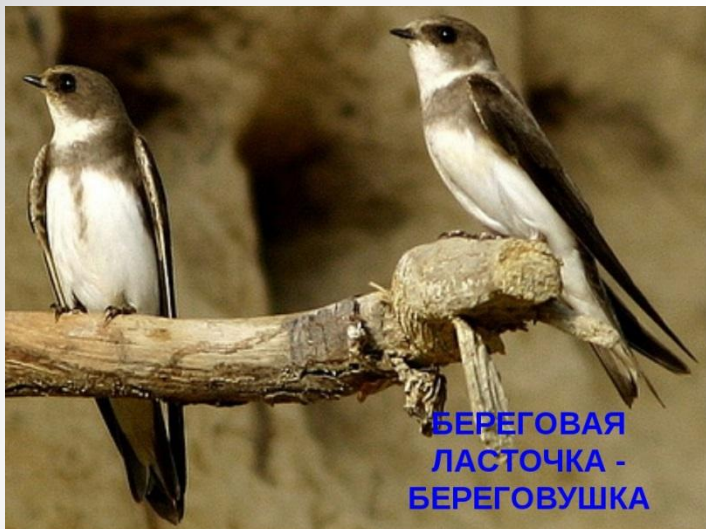
БЕРЕГОВАЯ ЛАСТОЧКА - БЕРЕГОВУШКА