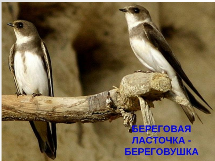
БЕРЕГОВАЯ ЛАСТОЧКА - БЕРЕГОВУШКА