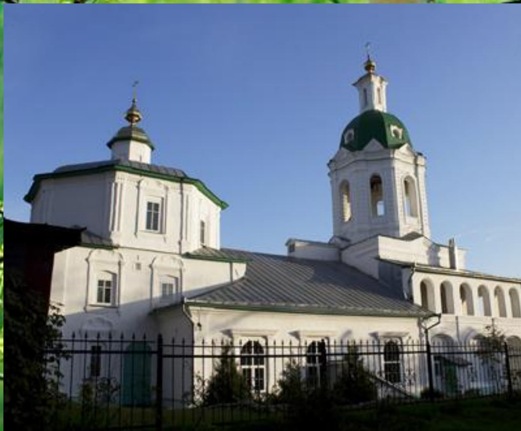
Троицкий храм , г. Касимов