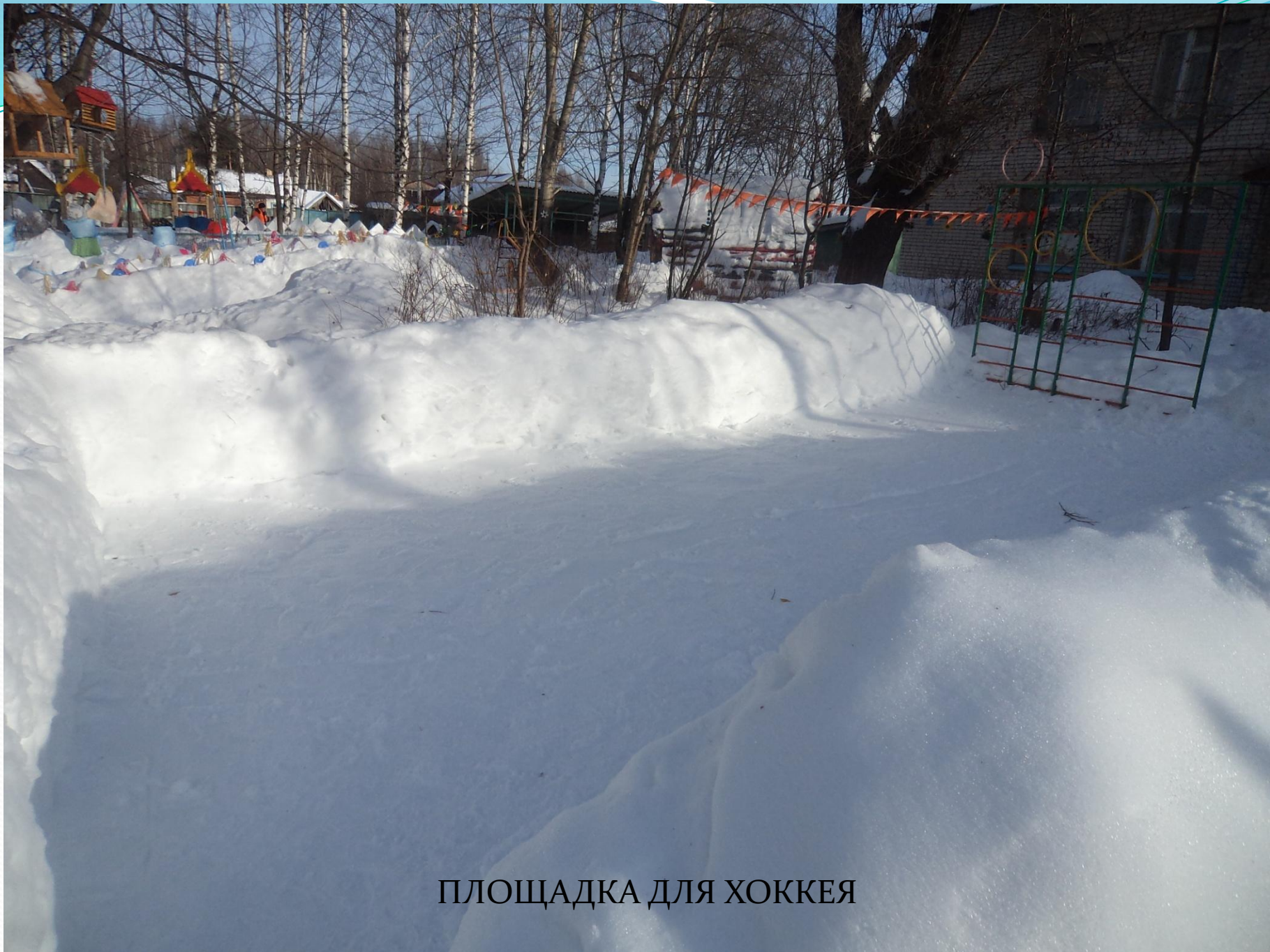
ПЛОЩАДКА ДЛЯ ХОККЕЯ