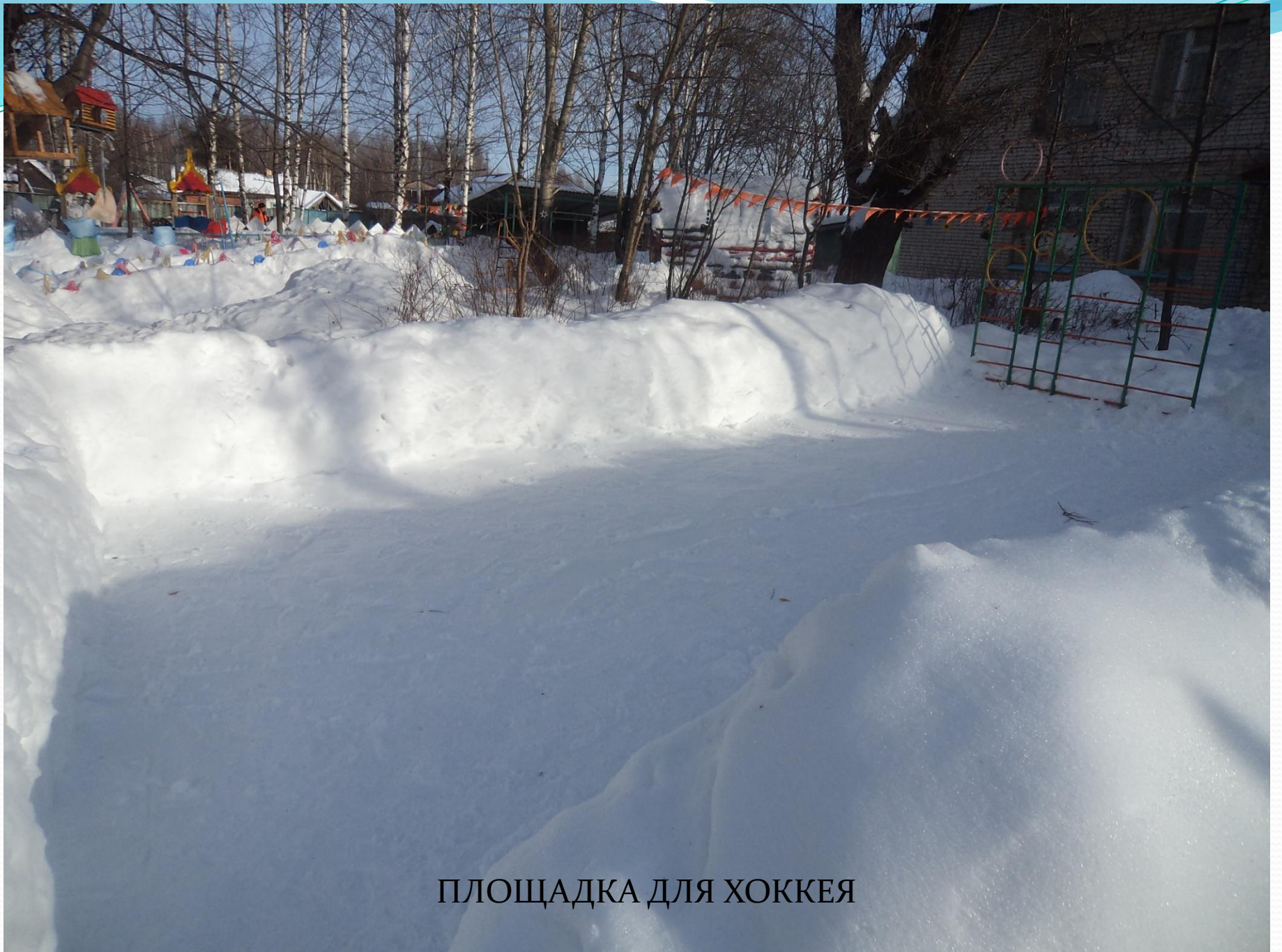
ПЛОЩАДКА ДЛЯ ХОККЕЯ