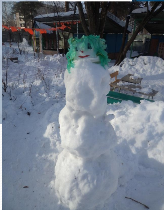
СНЕГОВИКИ СДЕЛАННЫЕ ДЕТЬМИ