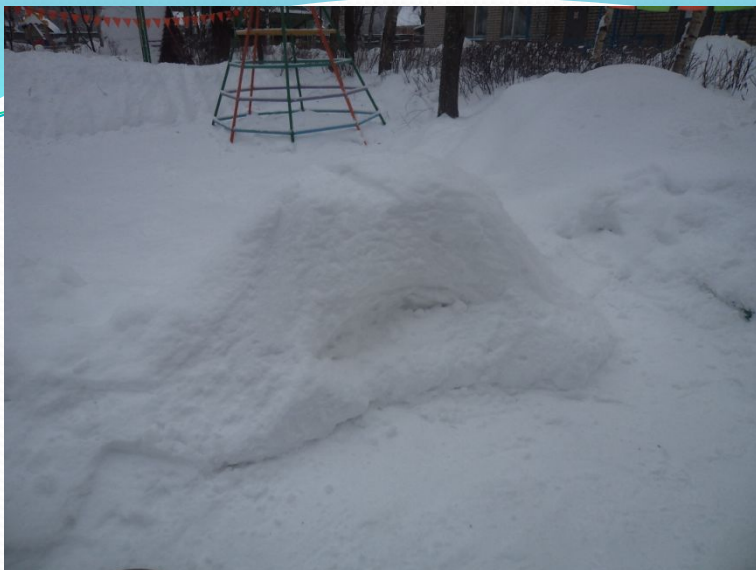
ДУГА ДЛЯ ПОДЛЕЗАНИЯ