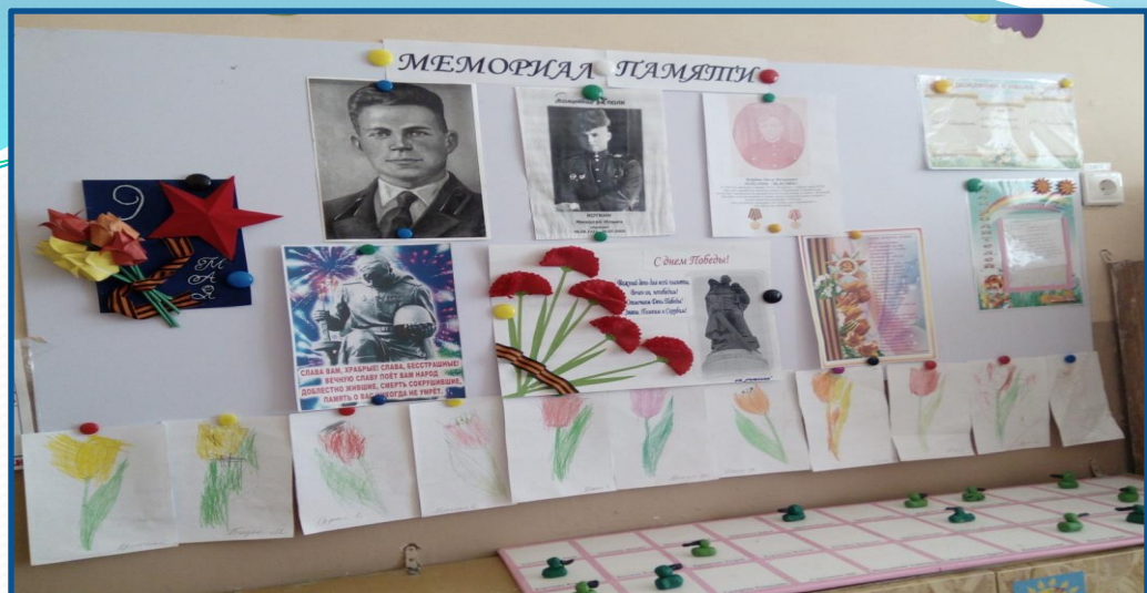
Мини-мемориал «Бессмертный полк»