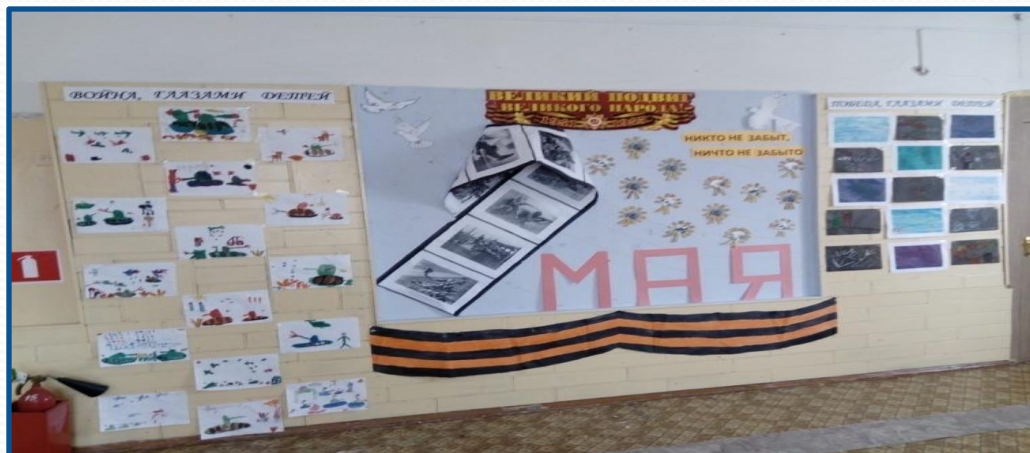
Наши дети с родителями приняли активное участие в выставке работ на военную тематику.