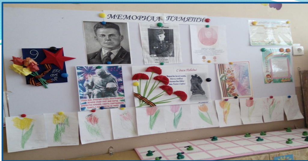
Мини-мемориал «Бессмертный полк»