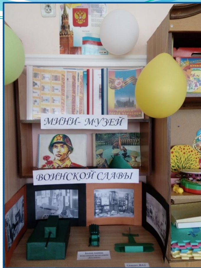
Вот такой мини – музей воинской славы получился у нас благодаря поддержке и участию родителей.