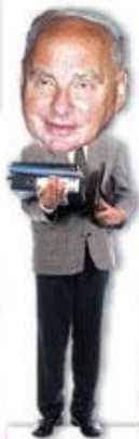
Виталий Вульф юрист МГУ