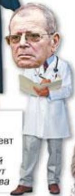
Аркадий Арканов врач-терапевт Первый Московский медицинский институт им. Сеченова