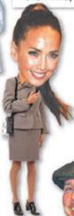
Жанна Фриске журналист МГУ (не окончила)