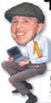
Гарик Сукачев инженер-проектировщик Железнодорожный техникум