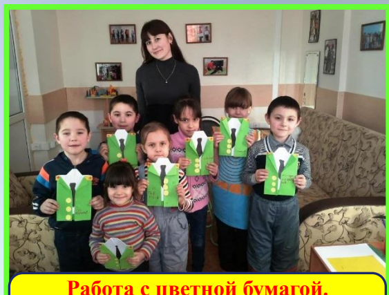
Работа с цветной бумагой. Изготовление открытки «Мундир»