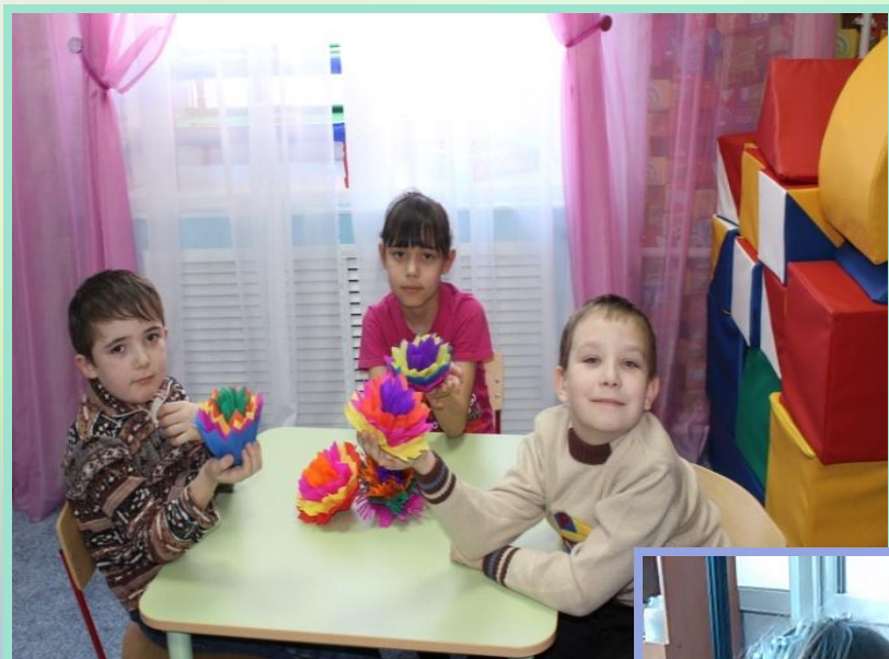
Работа с гофрированной бумагой «Объемные цветы»