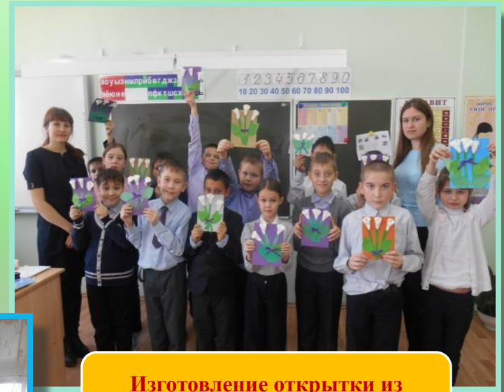
Изготовление открытки из ватных дисков