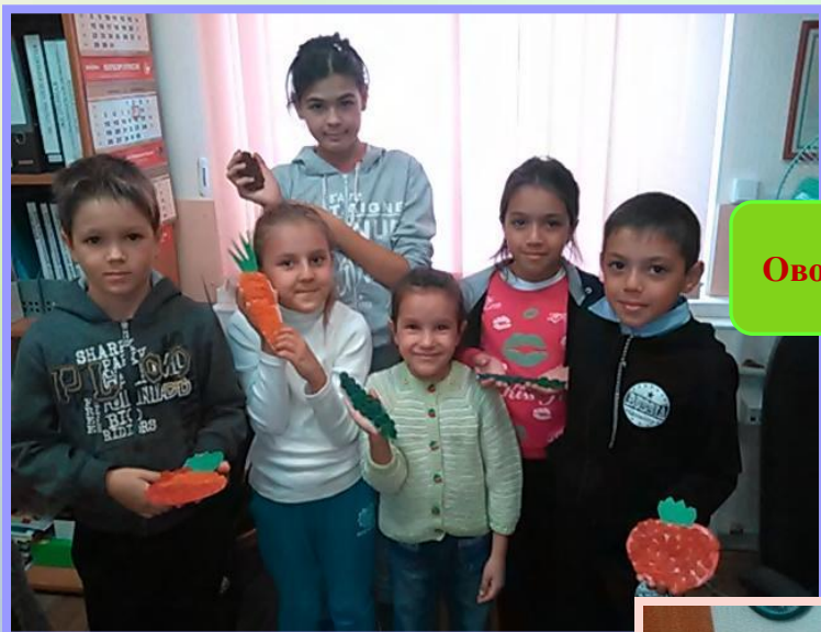
Овощи из макаронных изделий