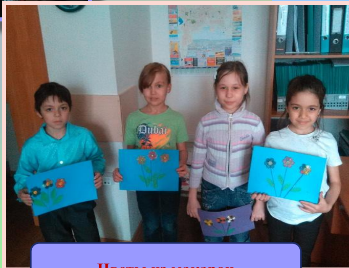
Цветы из макарон