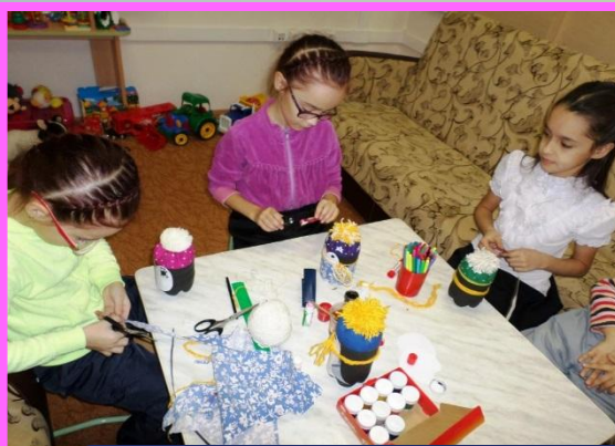
Изготовление поделок из бросового материала. Новогодняя игрушка «Пингвин»