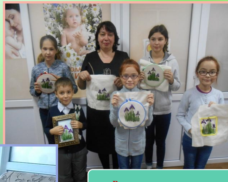
Вышивка из атласных лент