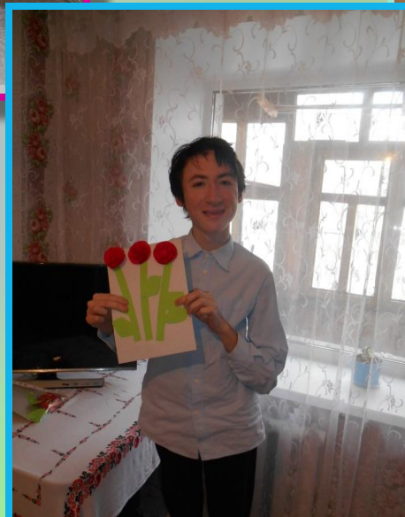
Аппликация с цветной бумагой