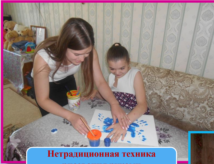
Нетрадиционная техника рисования руками «Веселые ладошки»