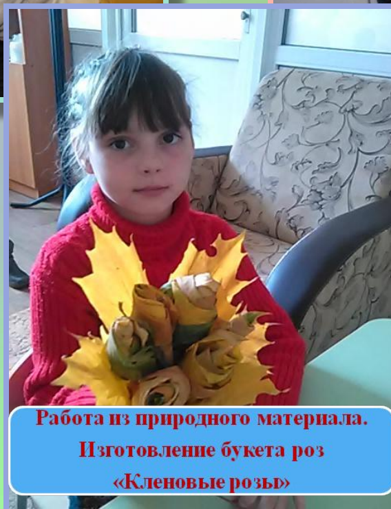
Работа из природного материала. Изготовление букета роз «Кленовые розы»