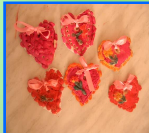
Лепка из соленого теста