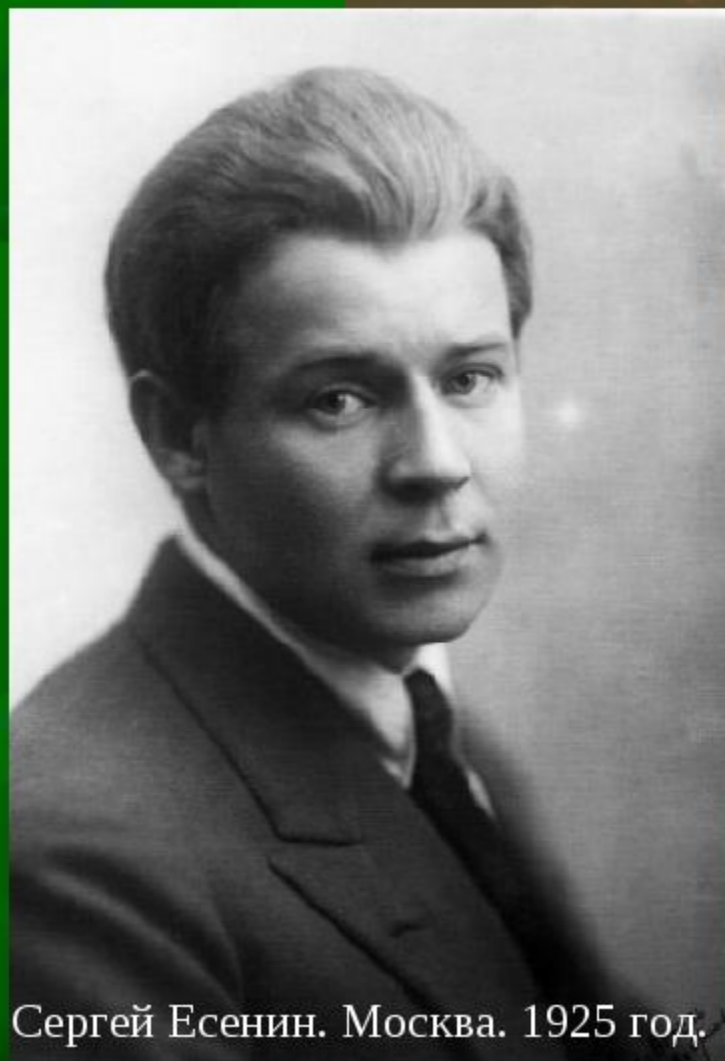
Сергей Есенин. Москва. 1925 год.

Я не отдам ее в чужие руки, Ни матери, ни другу, ни жене. Лишь только мне она свои вверяла звуки И песни нежные лишь только пела мне. Но и тогда, Когда во всей планете Пройдет вражда племен, Исчезнет ложь и грусть, - Я буду воспевать Всем существом в поэте Шестую часть земли С названьем кратким "Русь".