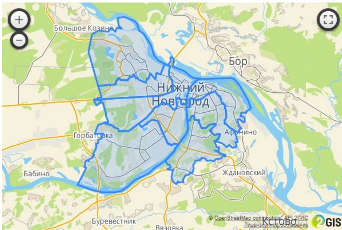
Фото взято :

Мне хочется немного рассказать о моем любимом городе-Нижнем Новгороде.