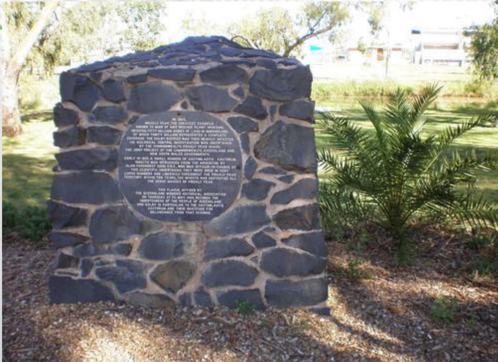
Памятник личинкам, спасшим Австралию. Долина реки Дарлинг.