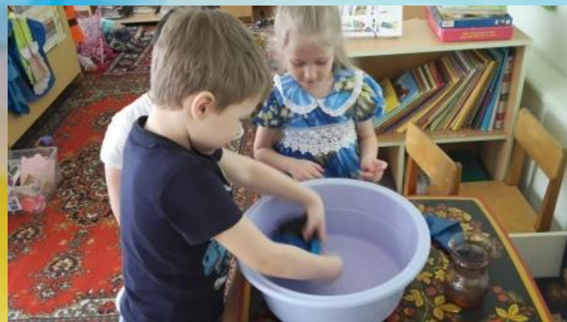
хлопчатобумажная ткань хорошо впитывает воду