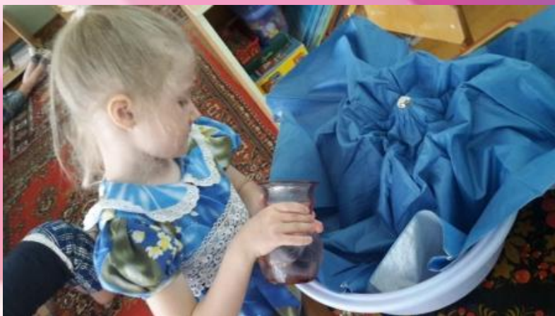
Плащевая ткань не пропускает воду