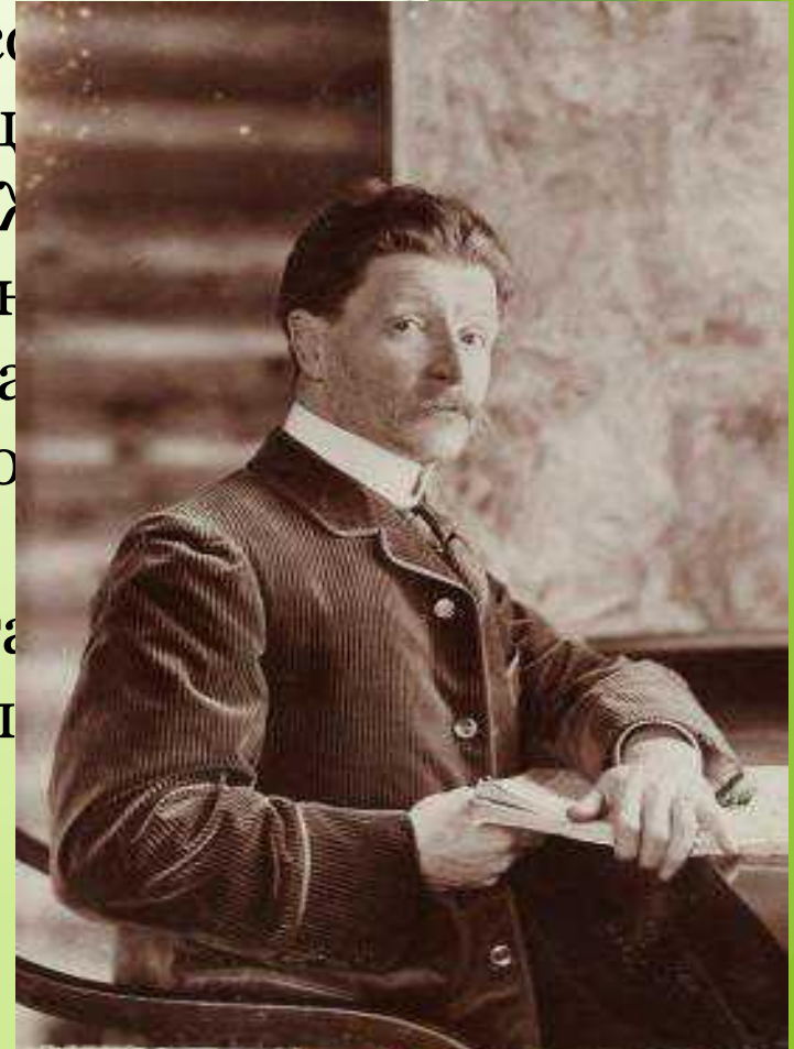
Михаил Александрович Врубель