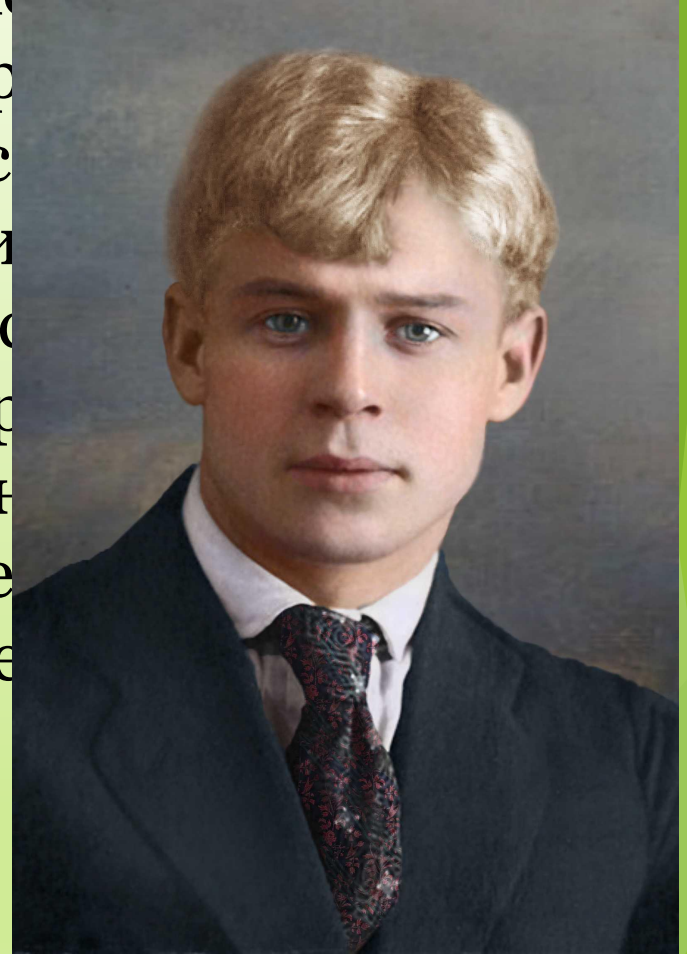
Сергей Александрович Есенин