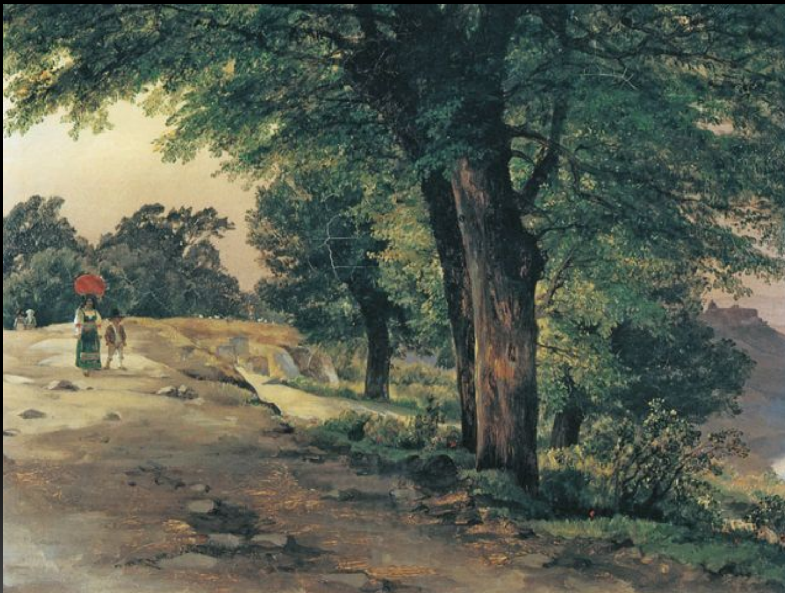
«В парке Киджи», 1837 г.