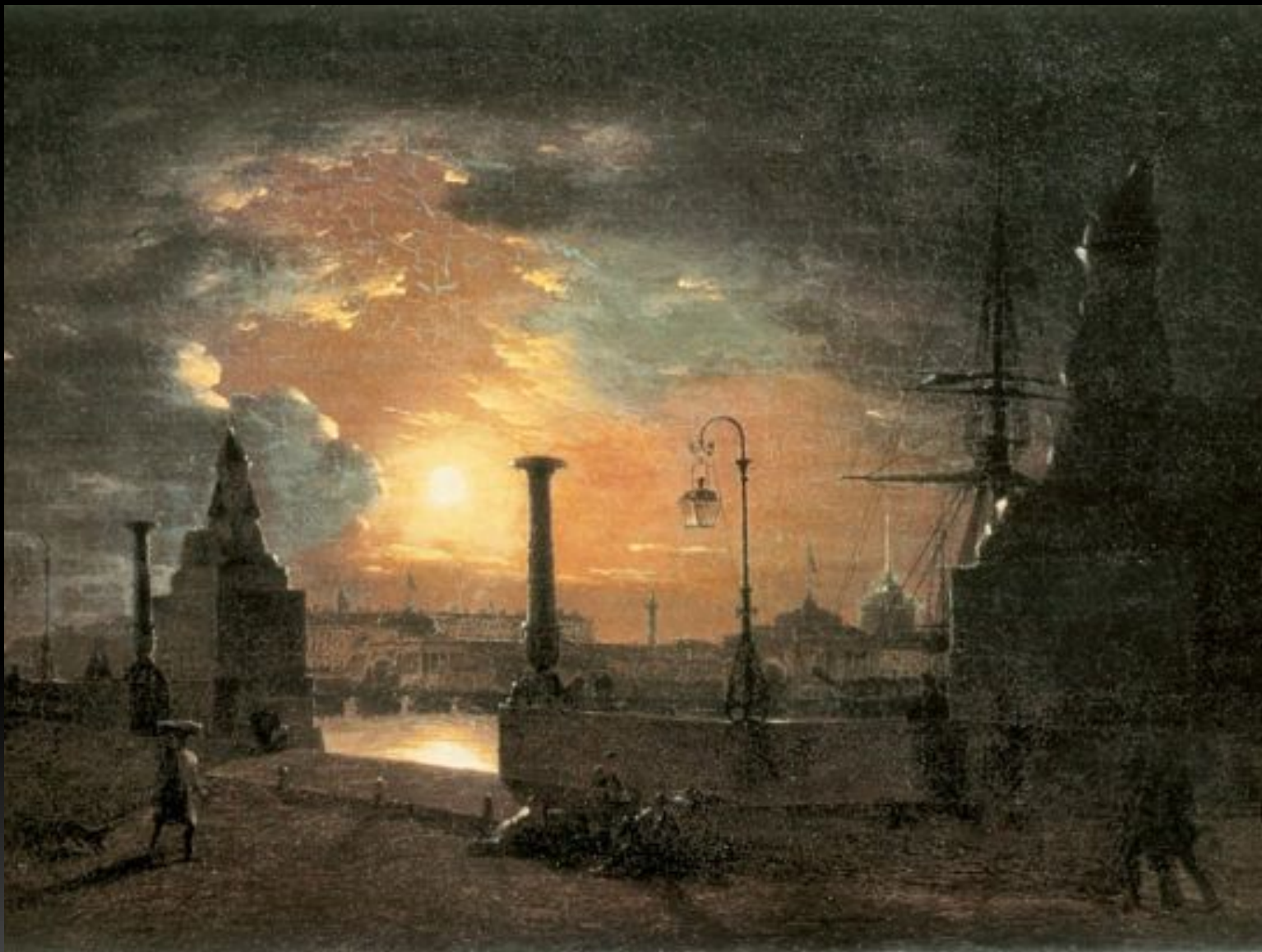
«Осенняя ночь в Петербурге» (Пристань с египетскими сфинксами на Неве ночью), 1835 г.