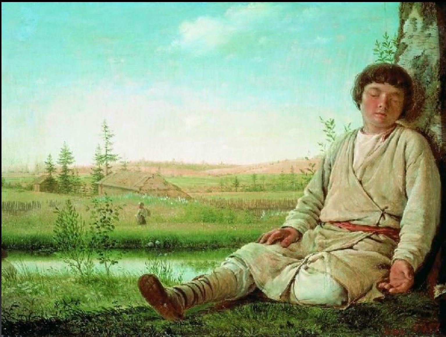
«Спящий пастушок», 1823-1826 гг.