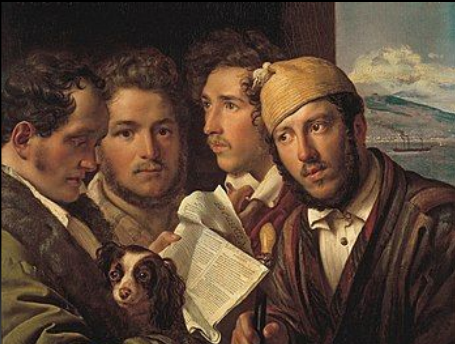
«Читатели газет в Неаполе», 1831 г.