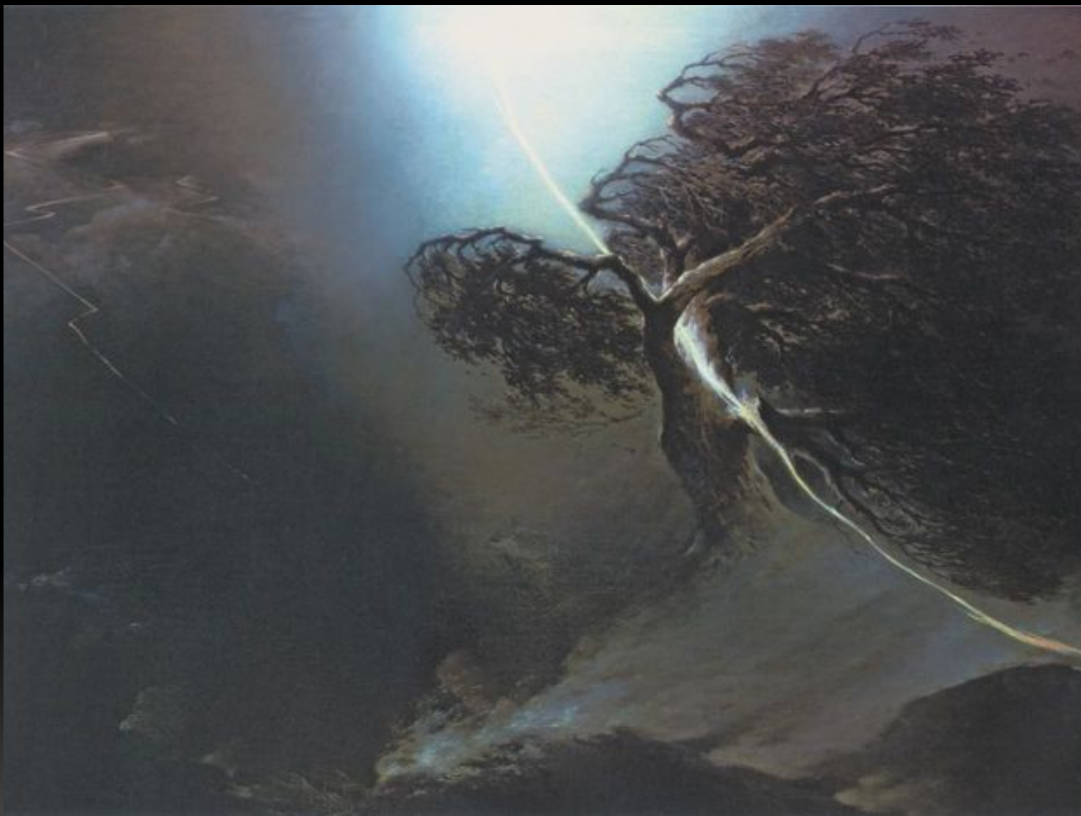
«Дуб, раздробленный молнией», 1842 г.