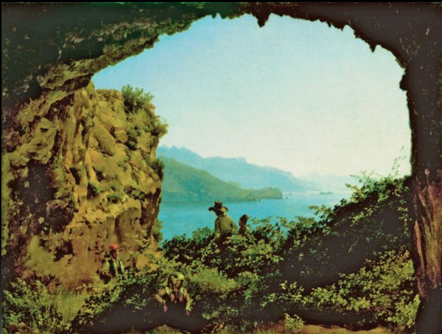
«Грот Матроманио на острове Капри», 1827 г.