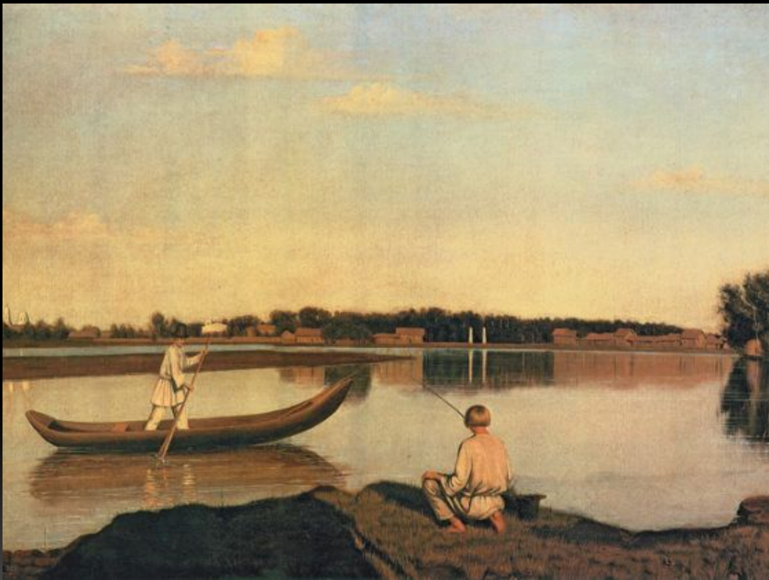
«Вид в усадьбе Спасское Тамбовской губернии», 1840?