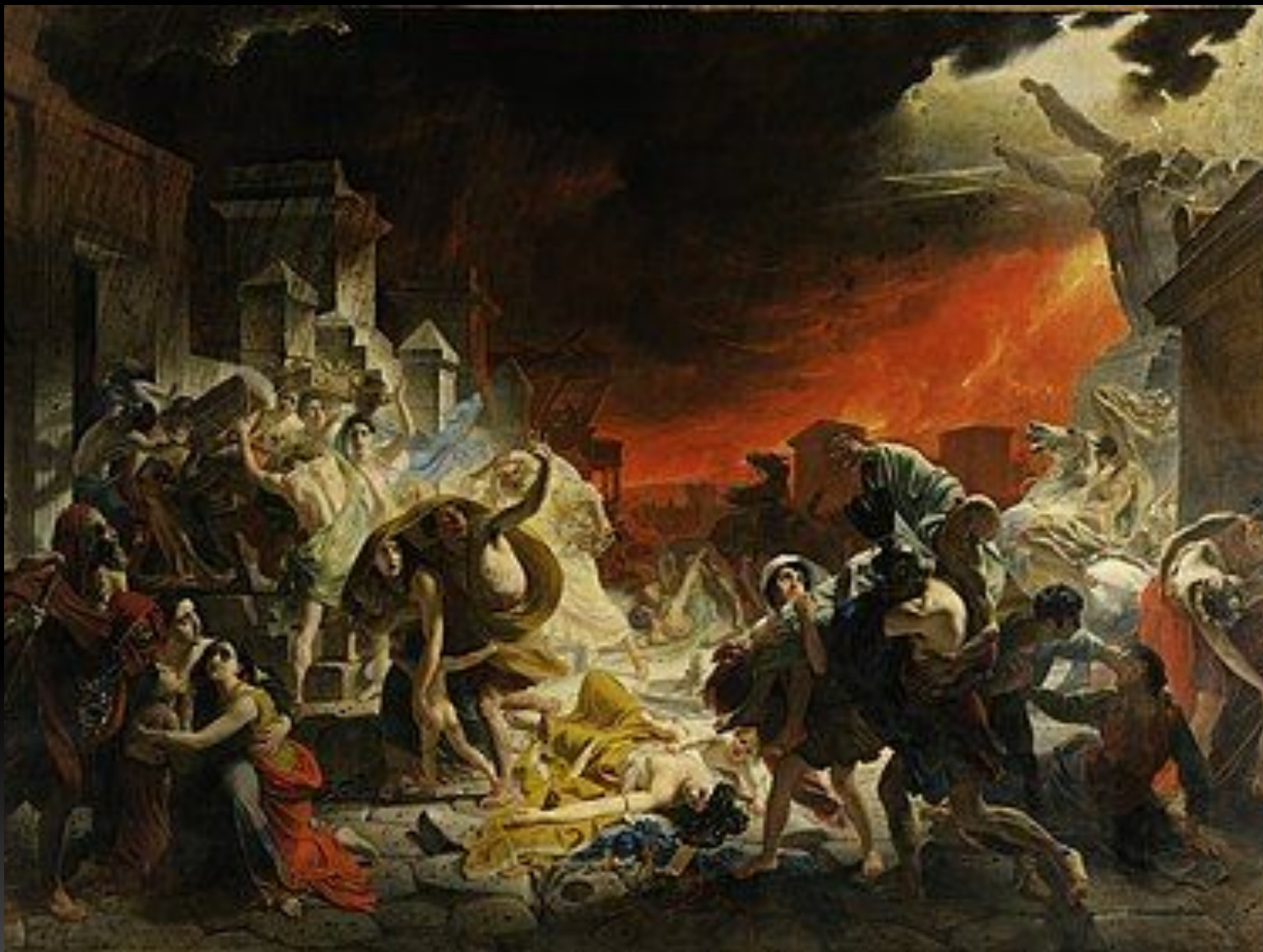
«Последний день Помпеи», 1833 г.