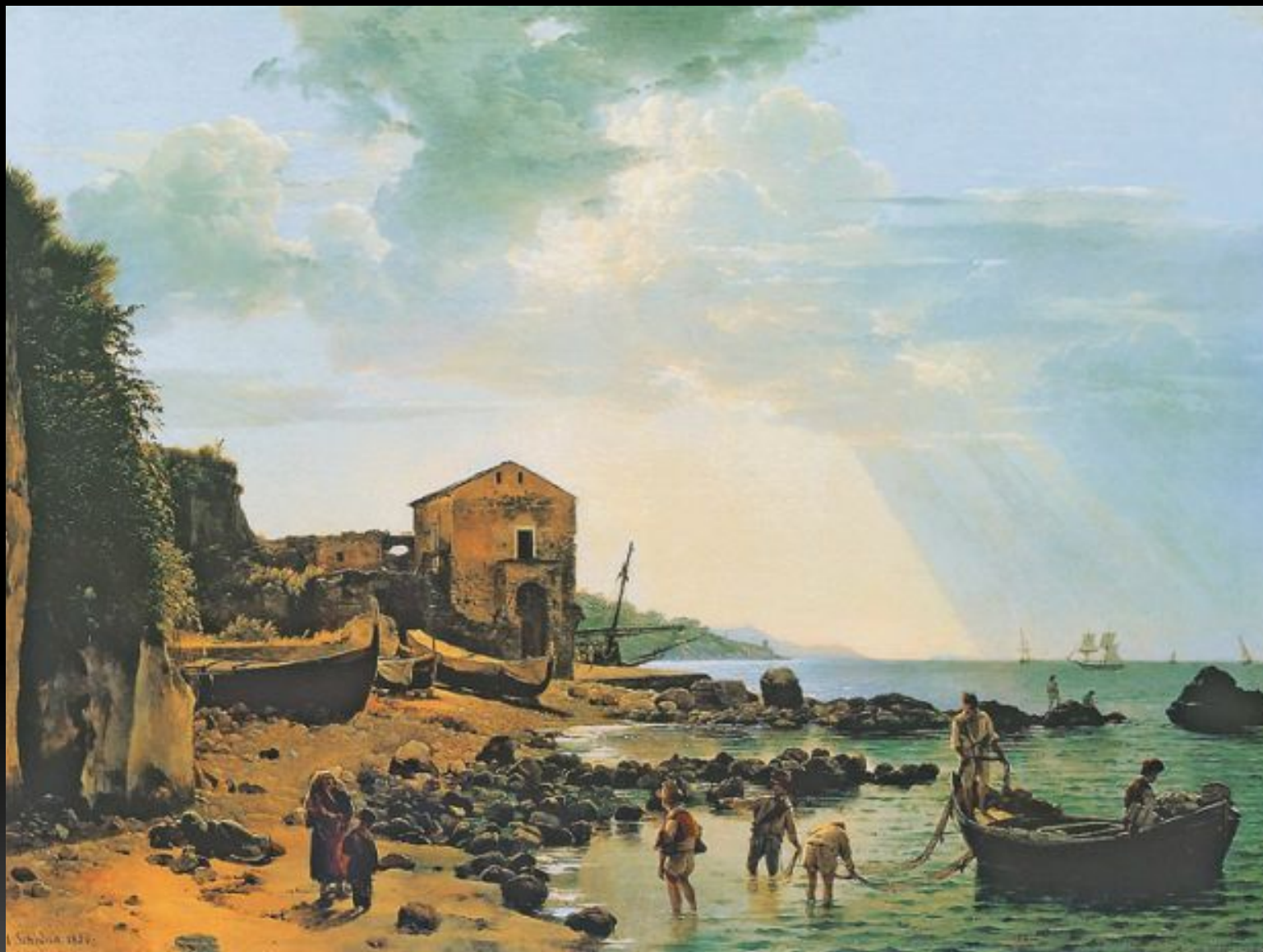
«Малая гавань в Сорренто с видом на острова Искья и Прочидо», 1826 г.