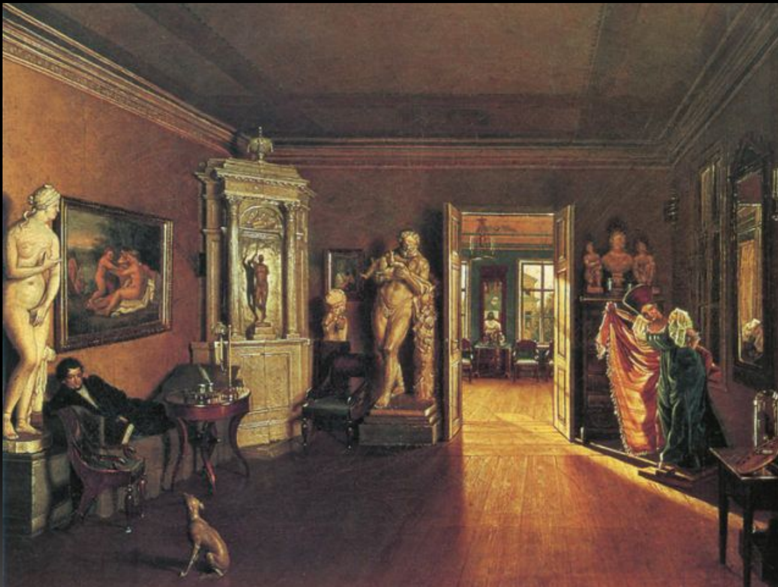
«Кабинет А. Г. Венецианова», 1839–1840 гг.