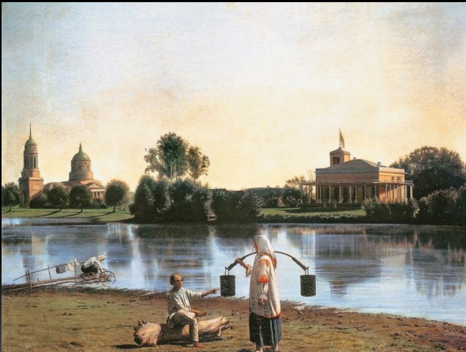
«Вид на усадьбу Спасское Тамбовской губернии», 1840-е