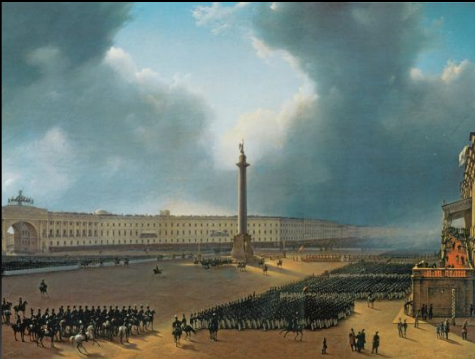
«Парад по случаю открытия памятника Александру I в Санкт-Петербурге 30 августа 1834 года», 1834 г.