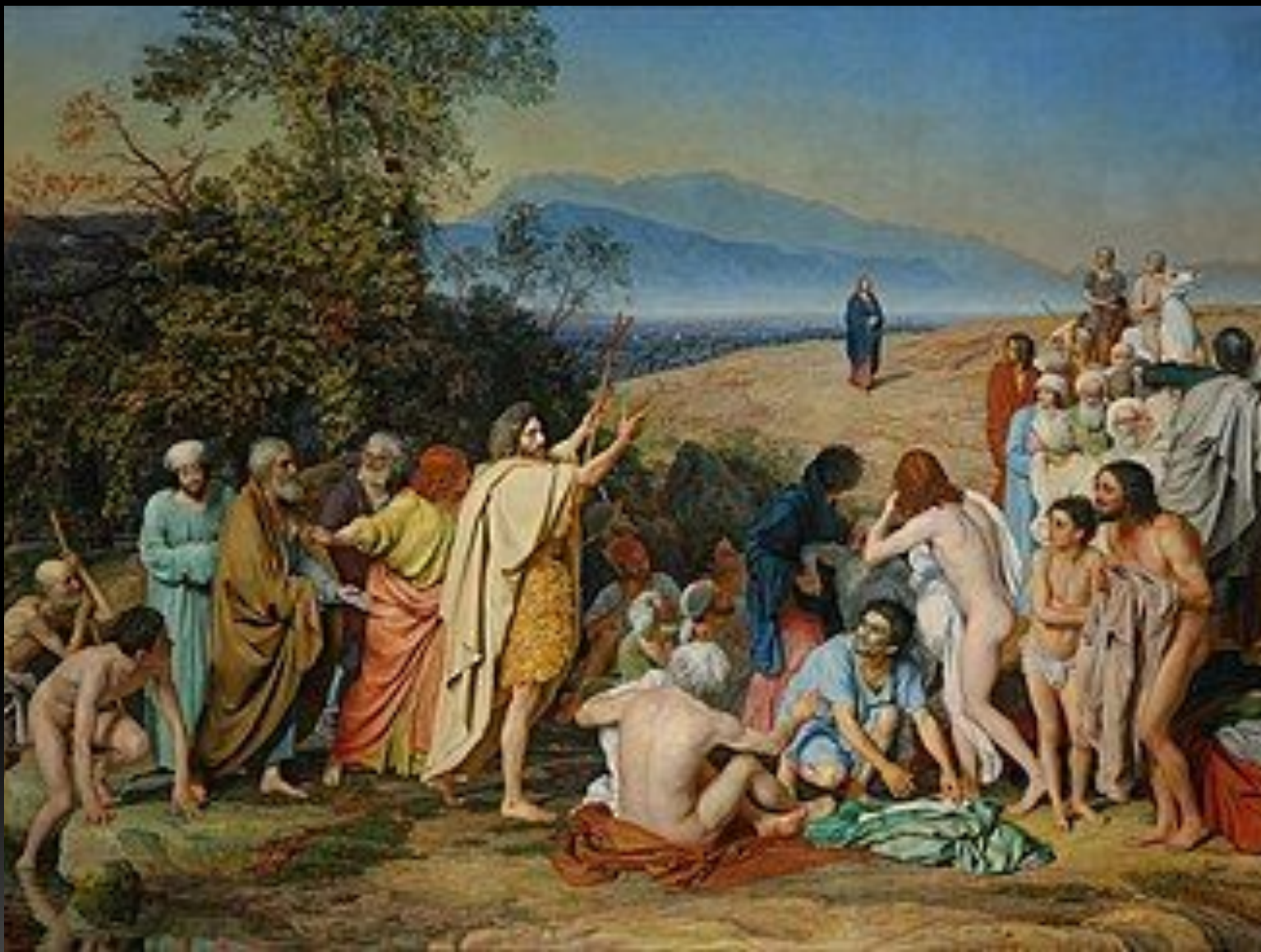
«Явление Христа народу» («Явление Мессии»), 1837 г.–1857 г.