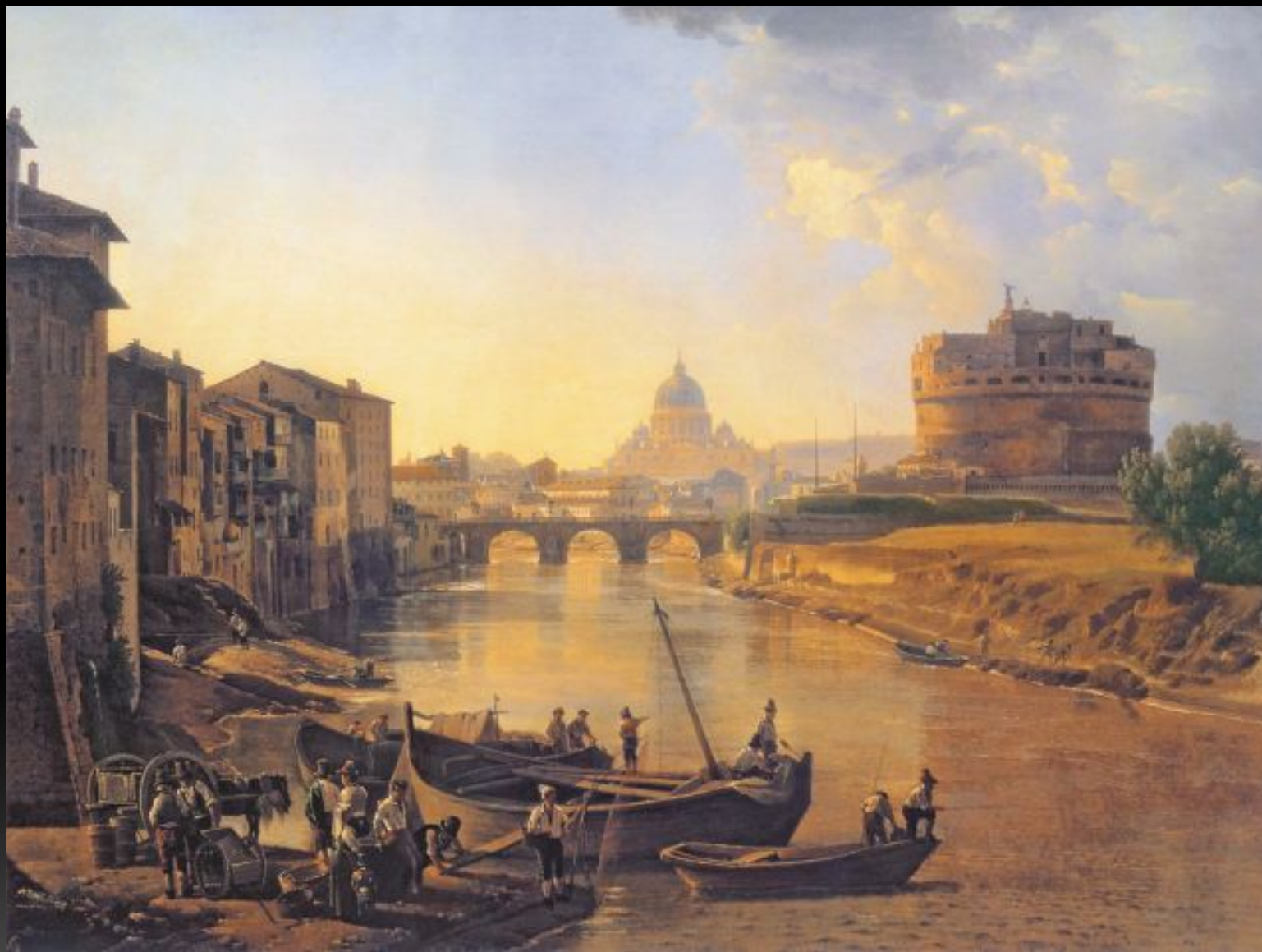
«Новый Рим. Замок Св. Ангела», 1824 г.