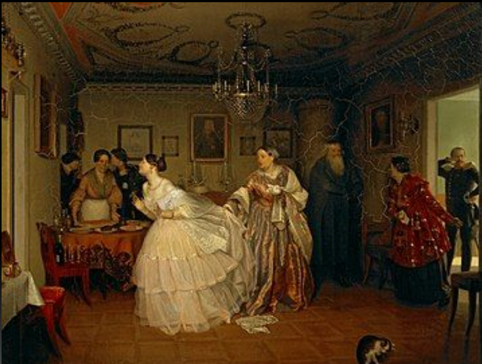
«Сватовство майора», 1848 г.