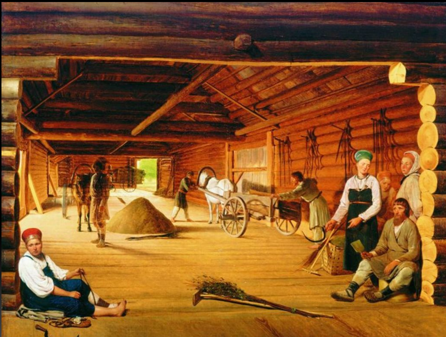
«Гумно», 1822 г.