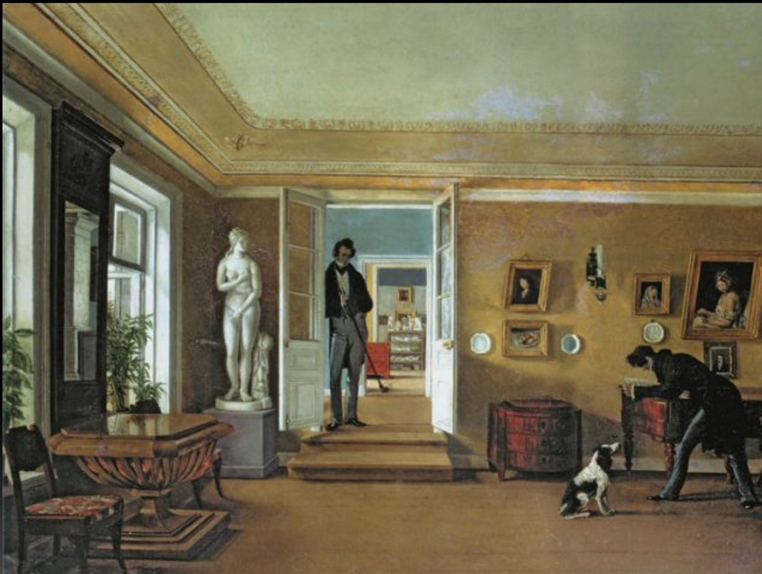
«В комнатах», Конец 1820-х