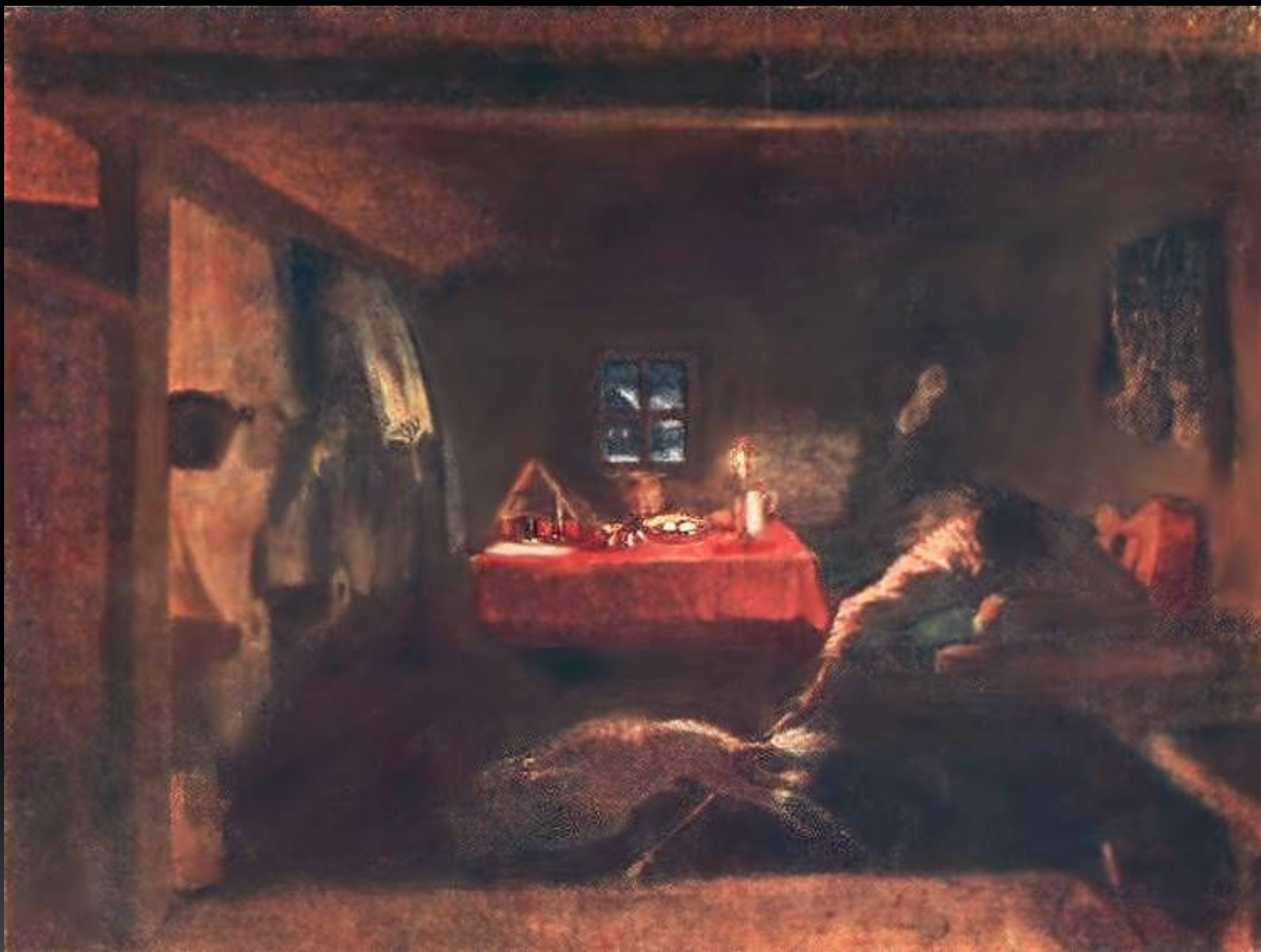
«Анкор, ещё Анкор!», 1851-52 г.