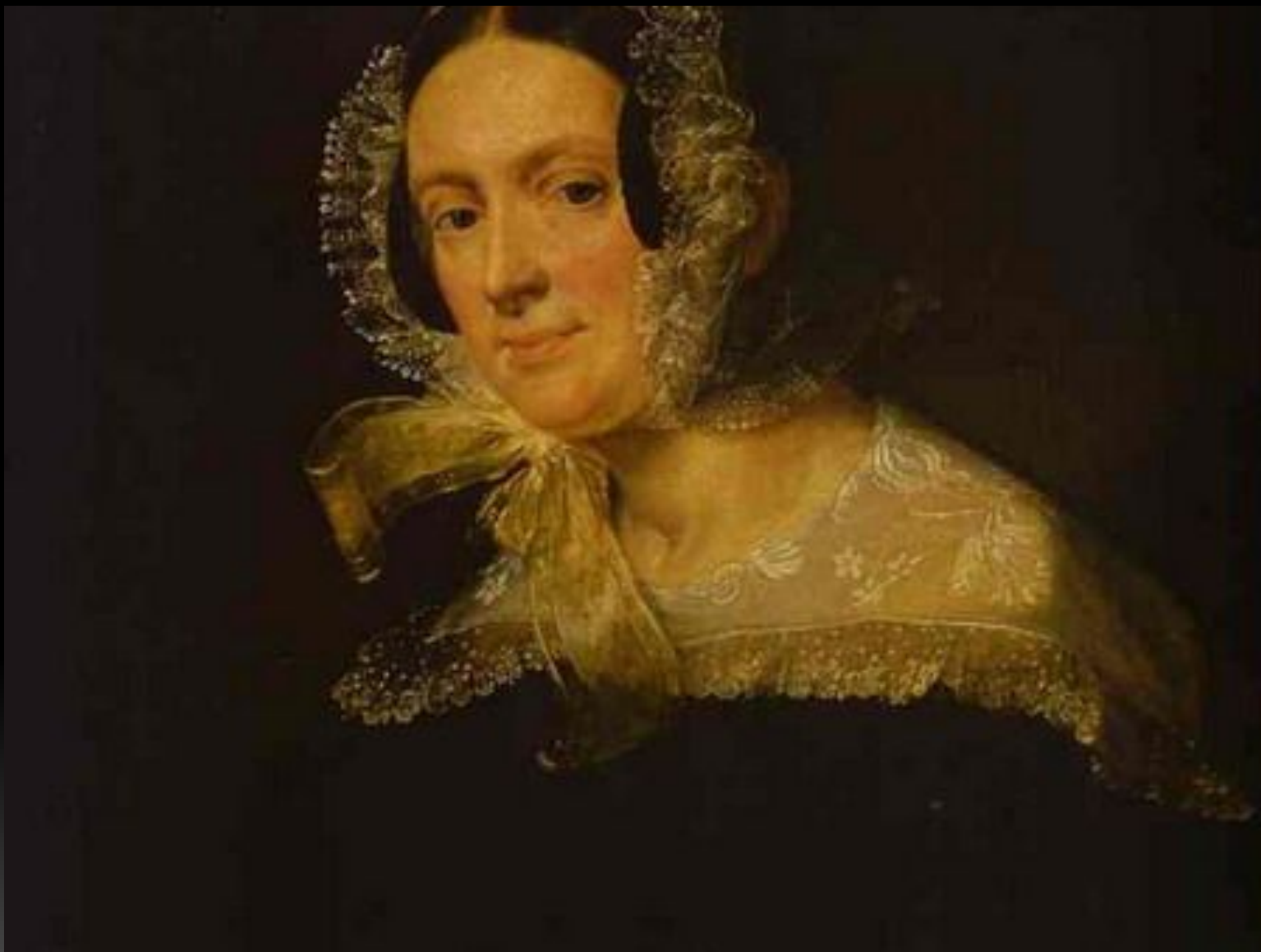
Киреевская Е. В., 1839 г.