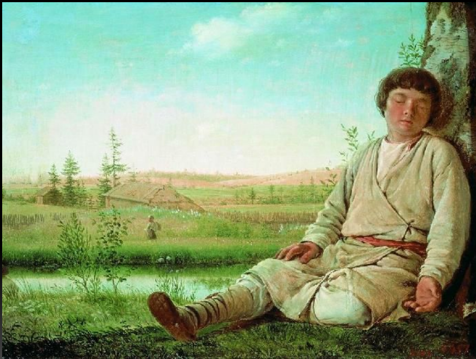
«Спящий пастушок», 1823-1826 гг.