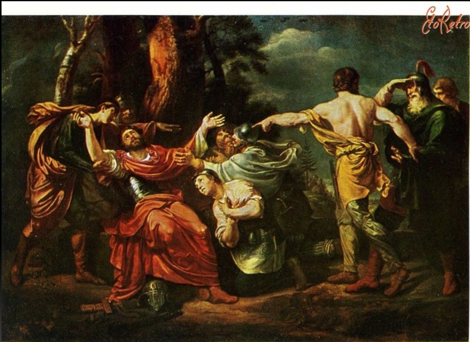
«Дмитрий Донской на Куликовом поле», 1805 г.