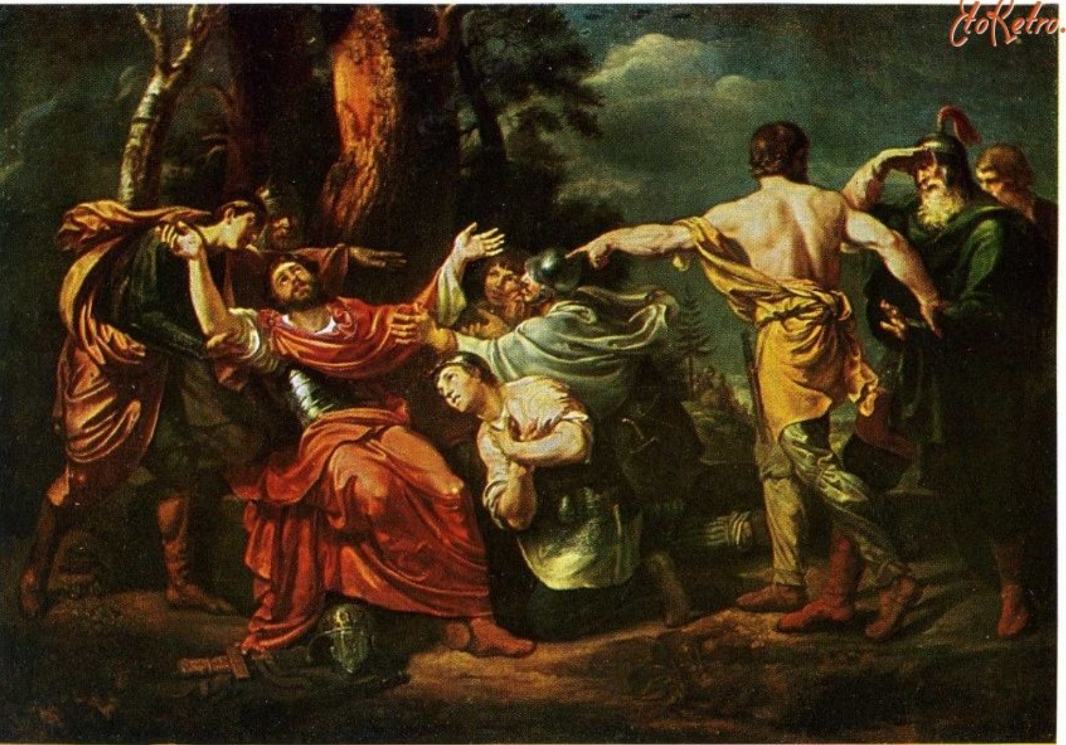
«Дмитрий Донской на Куликовом поле», 1805 г.