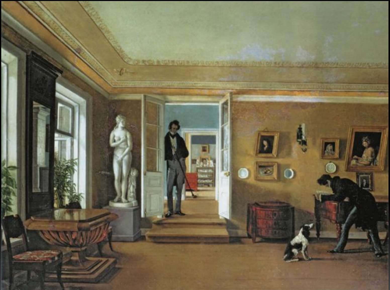
«В комнатах», Конец 1820-х