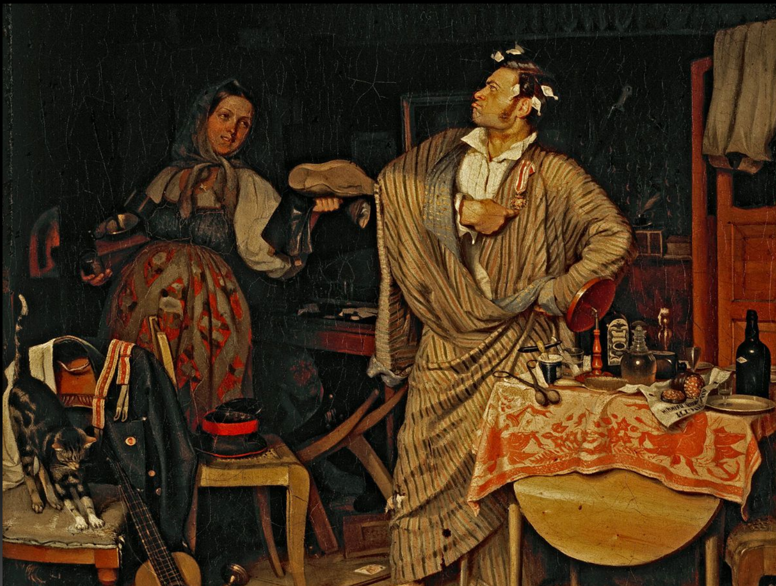
«Свежий кавалер», 1846 г.