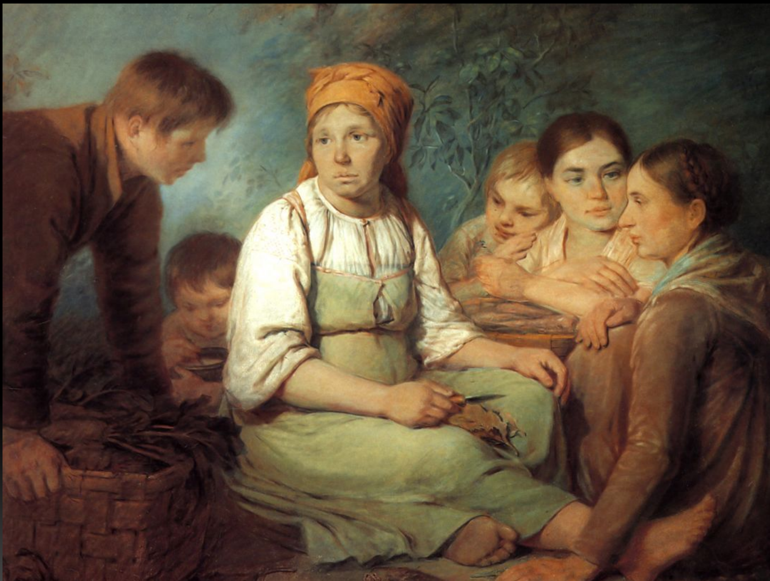
«Очищение свеклы», 1820-е