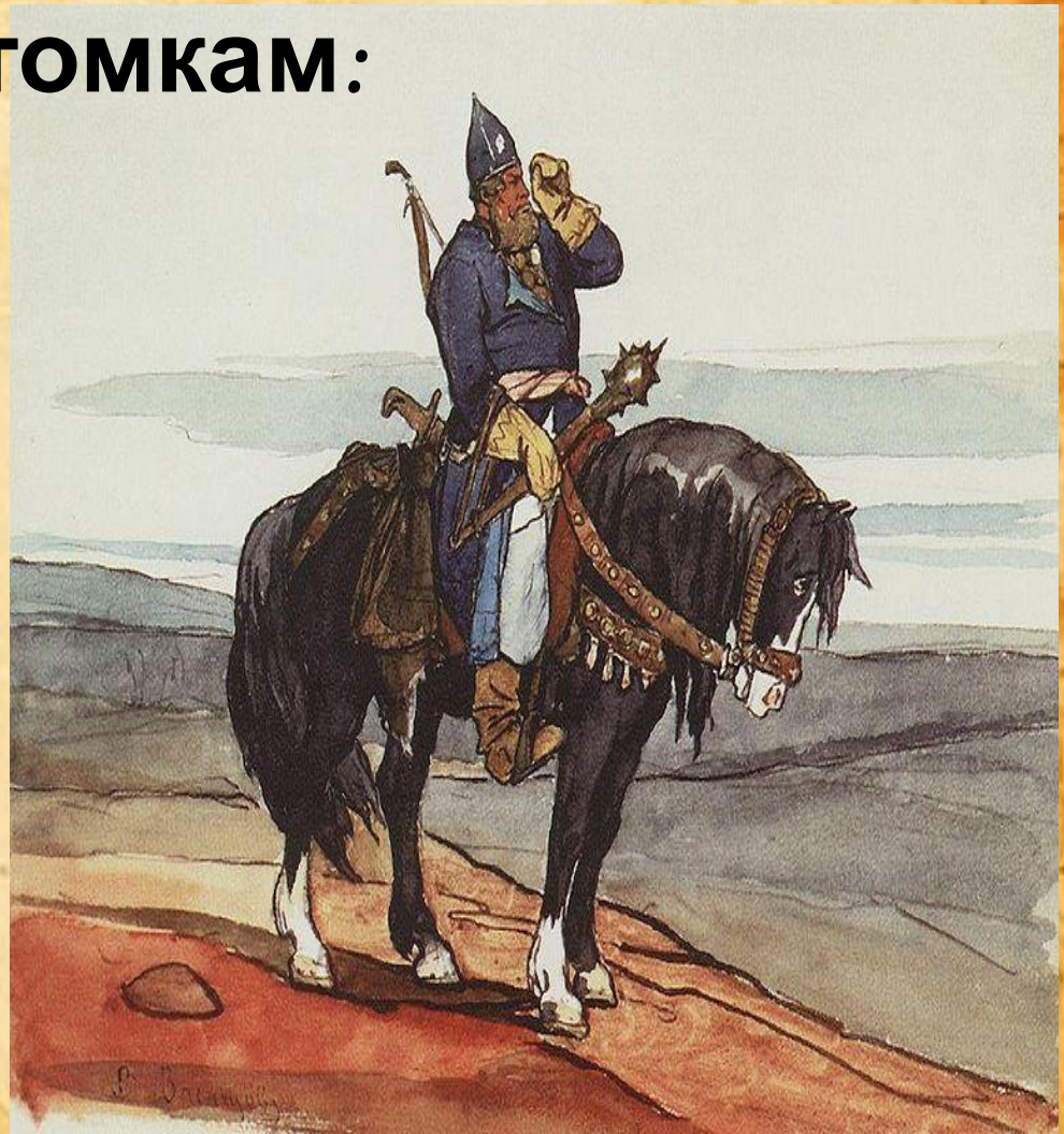
Виктор Васнецов «Богатырь» 1878.