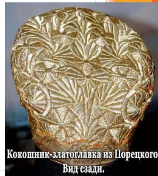
Кокошник-златоглавка из Порецкого. Вид сзади.