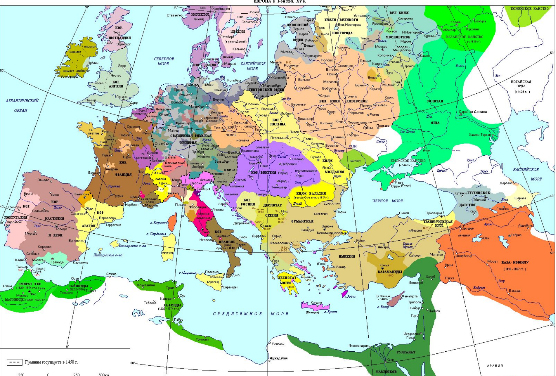
ЕВРОПА в 1-ой пол. XV в.