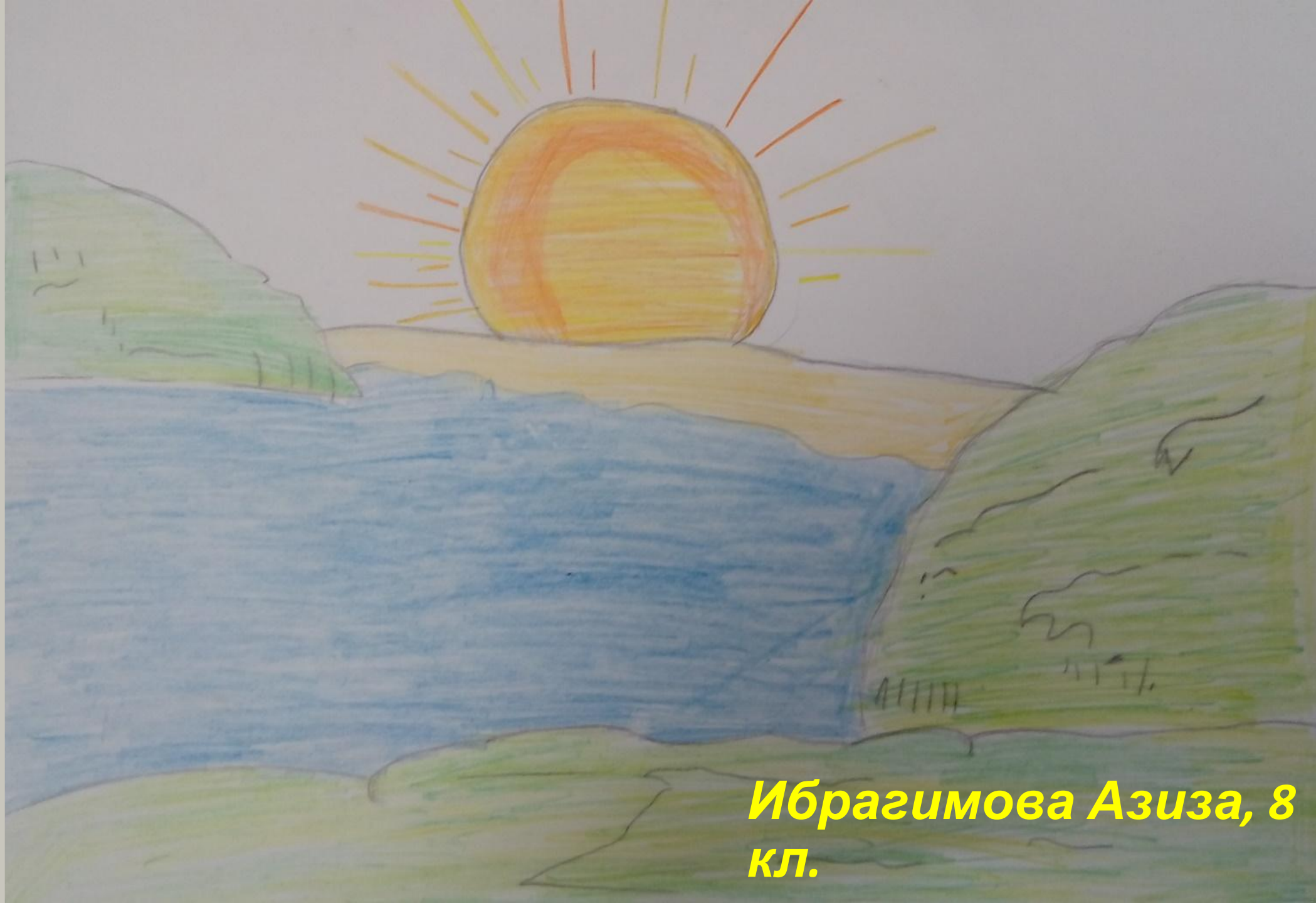
Ибрагимова Азиза, 8 кл.