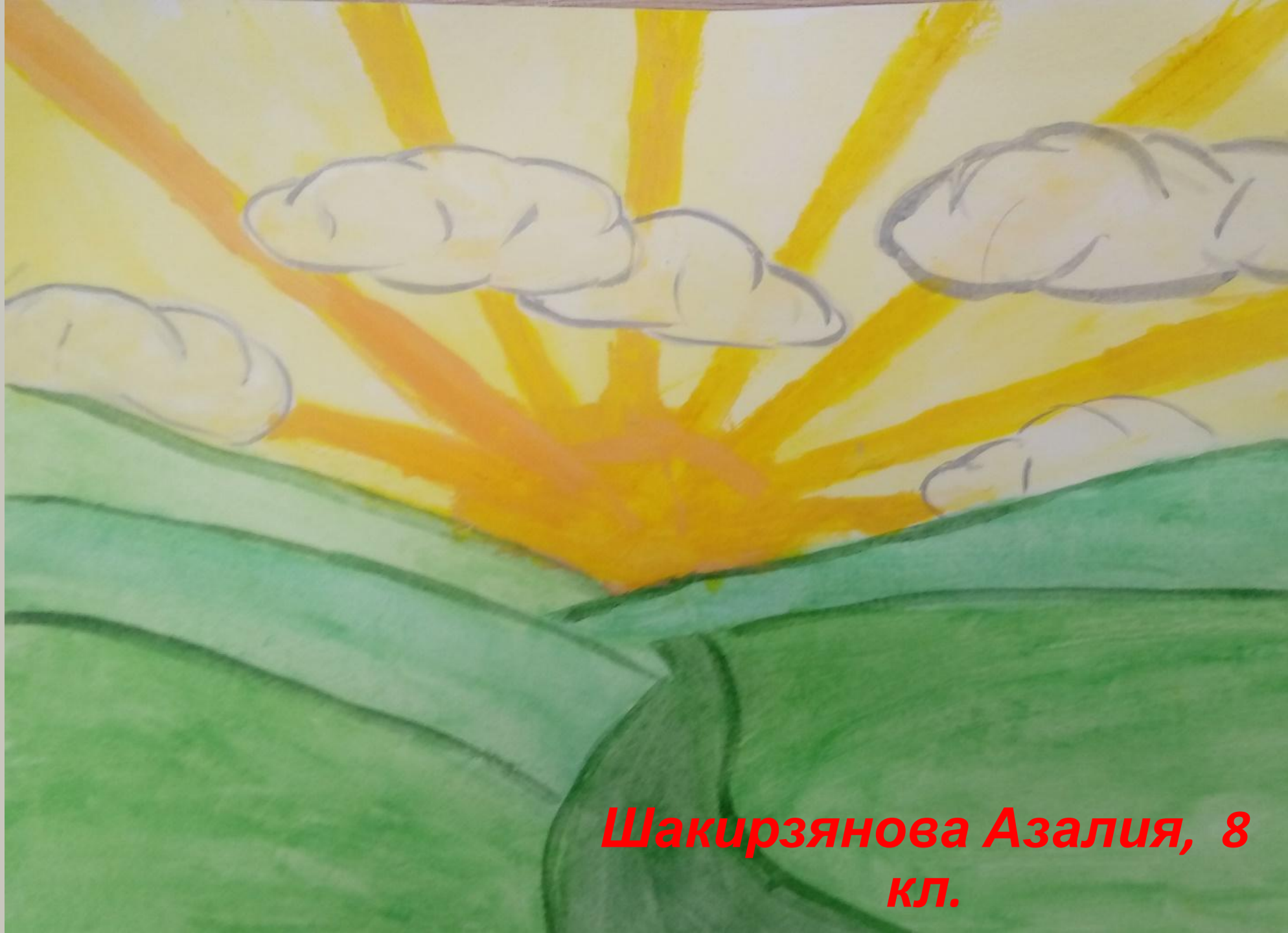
Шакирзянова Азалия, 8 кл.