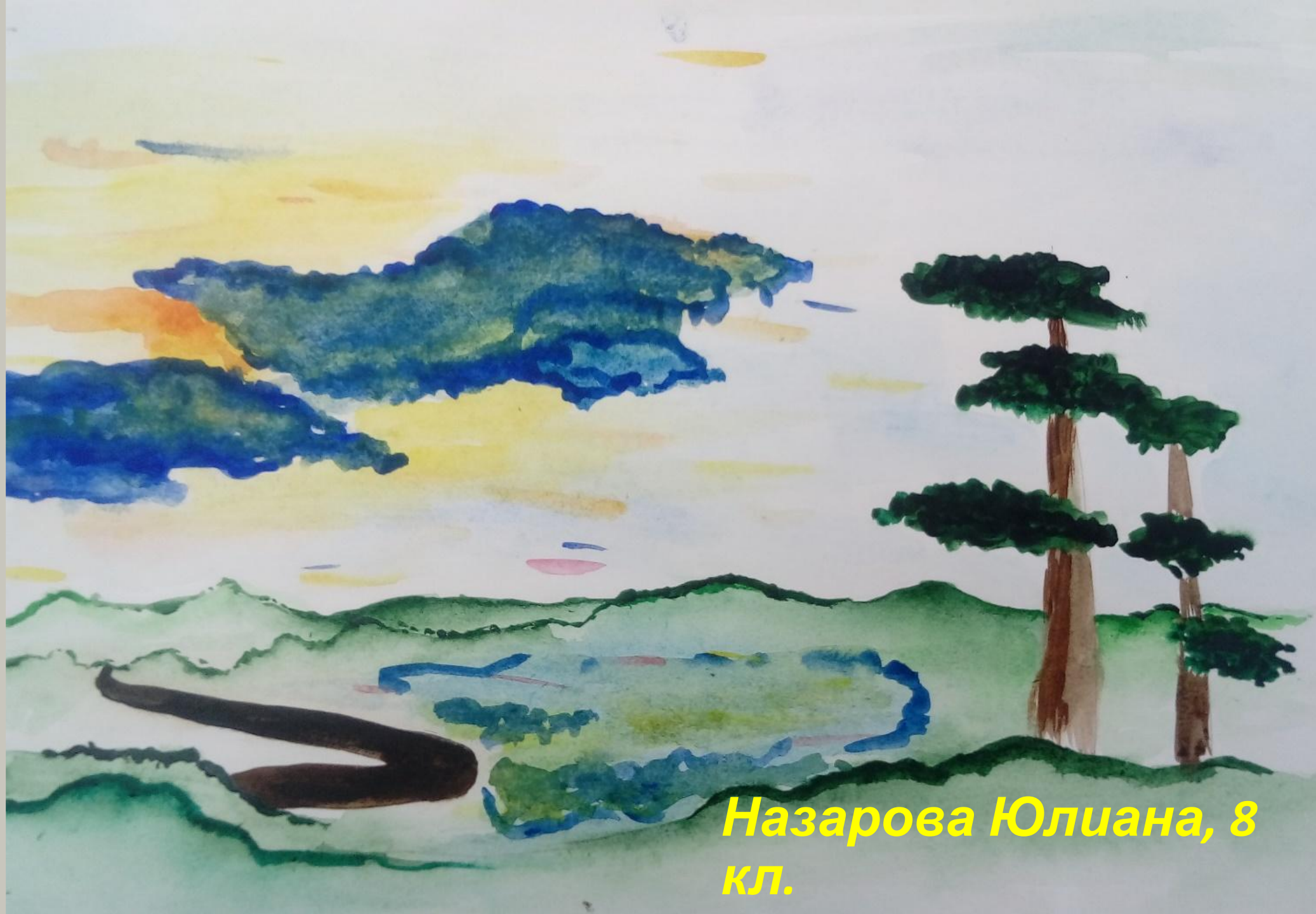
Назарова Юлиана, 8 кл.