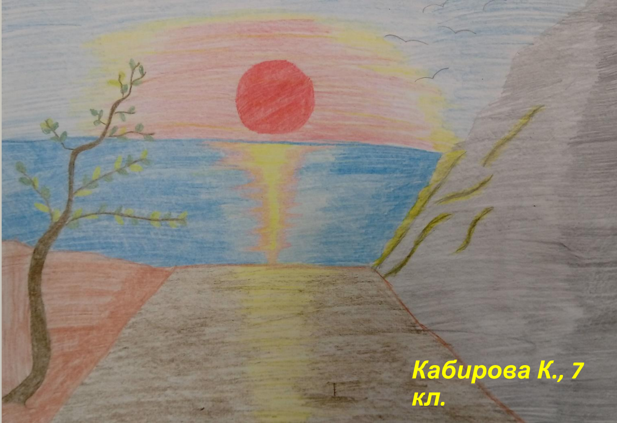
Кабирова К., 7 кл.