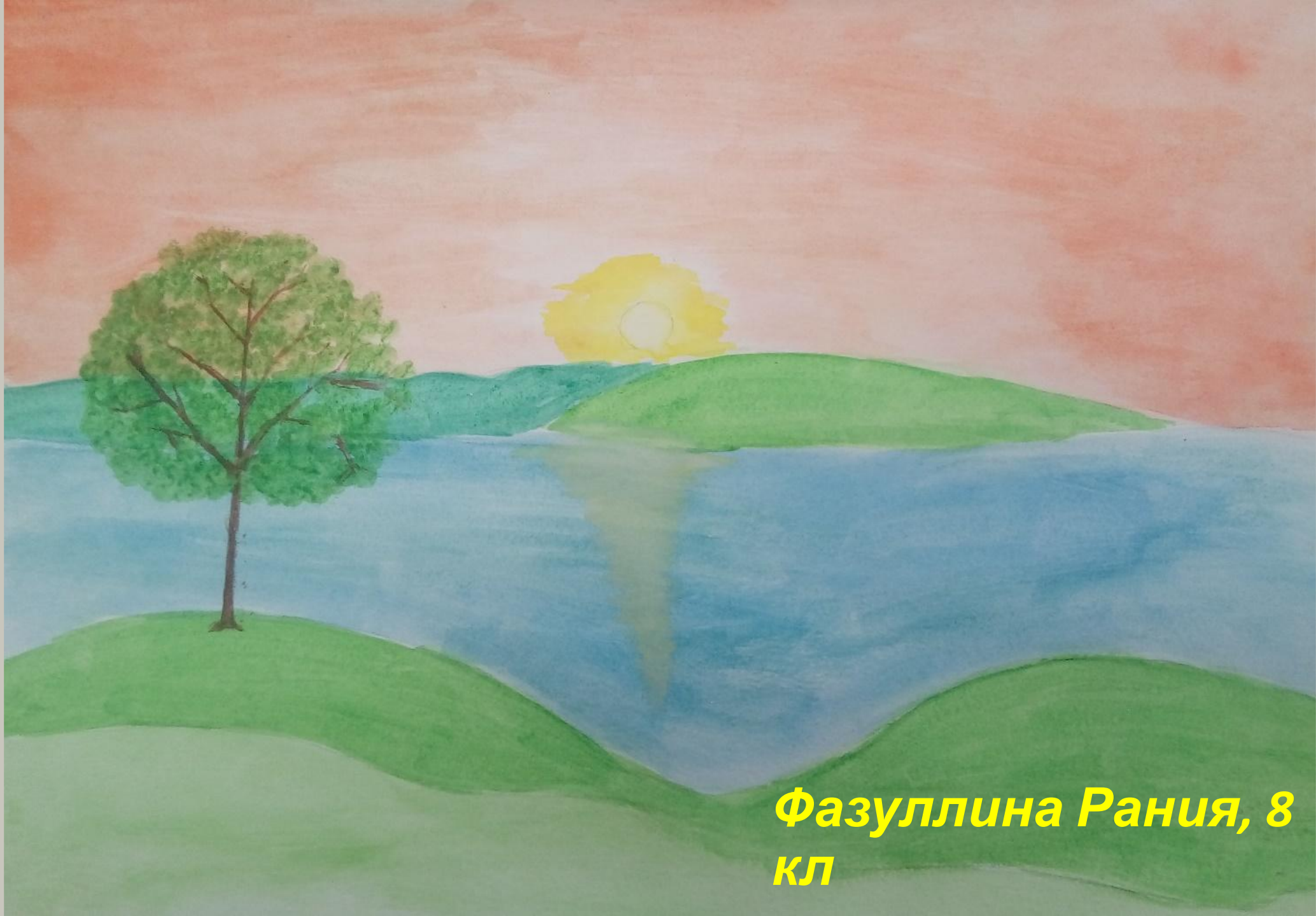
Фазуллина Рания, 8 кл