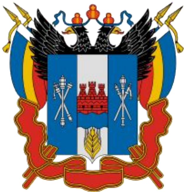
Герб Ростовской области