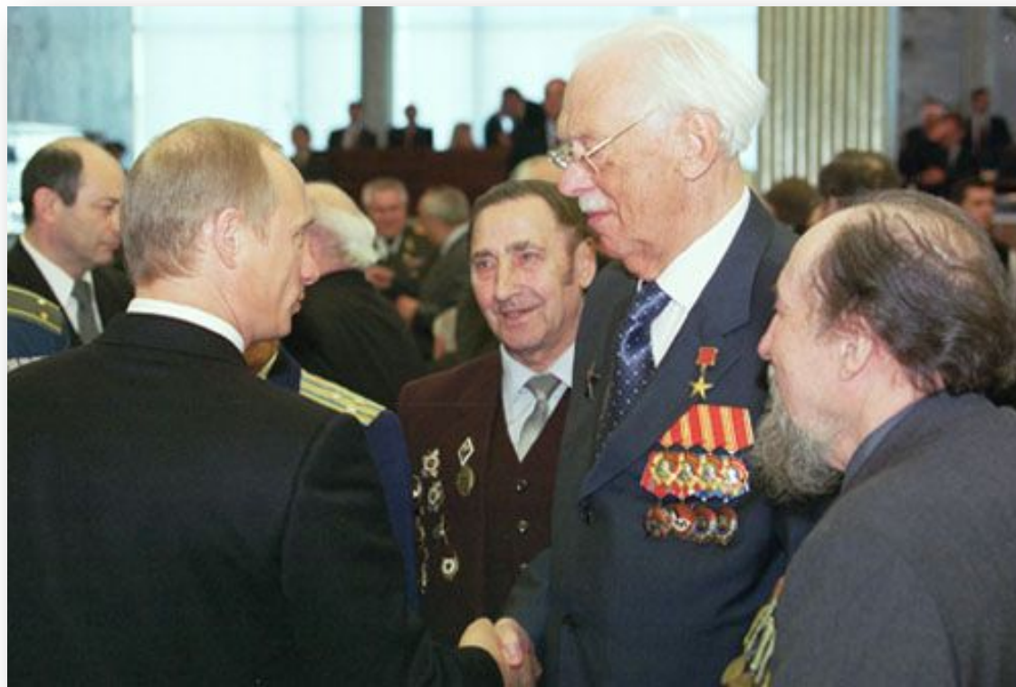
Владимир Путин с автором слов Гимна Сергеем Михалковым в Кремле, 2002 год

При официальном звучании гимна присутствующие должны стоять, мужчины — снять головные уборы. Если при этом происходит поднятие флага, присутствующие поворачиваются к нему лицом