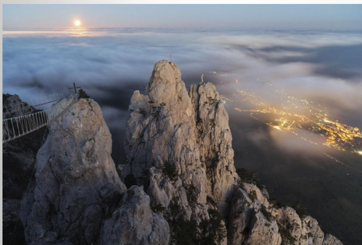
Ай-Петри – Святой Петр