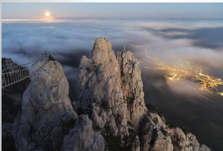
Ай-Тодор – Святой Федор