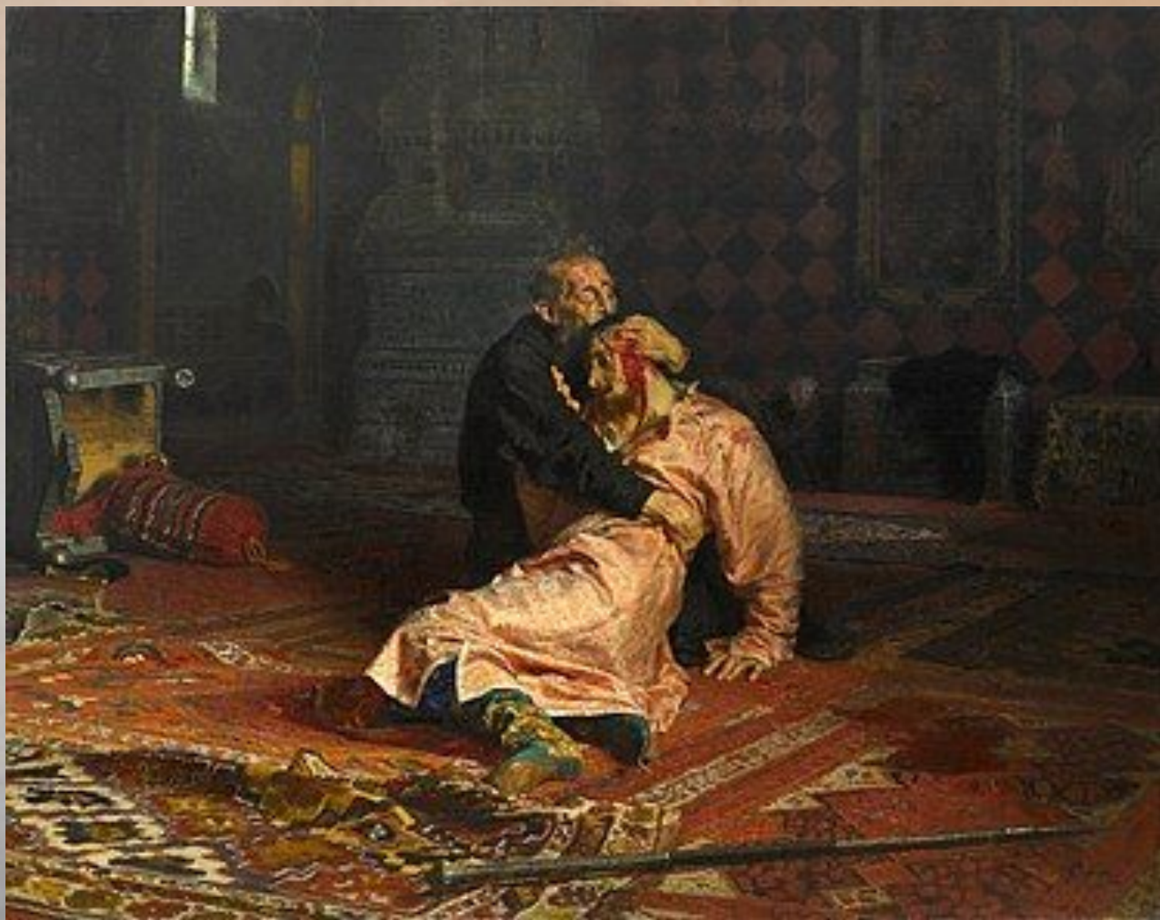
И. Е. Репин. «Иван Грозный и сын его Иван 16 ноября 1581 года». 1885.