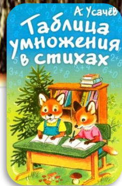
Таблица умножения на 4 в стихах А.Усачев