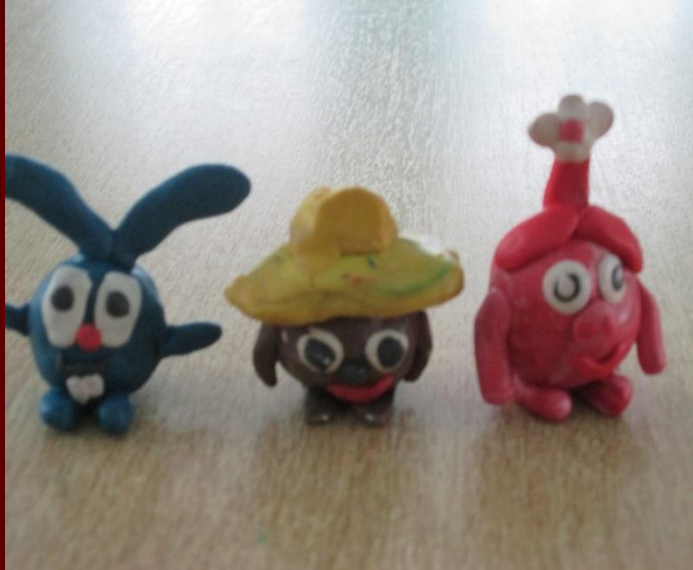
Лепка «Сказочный герой»