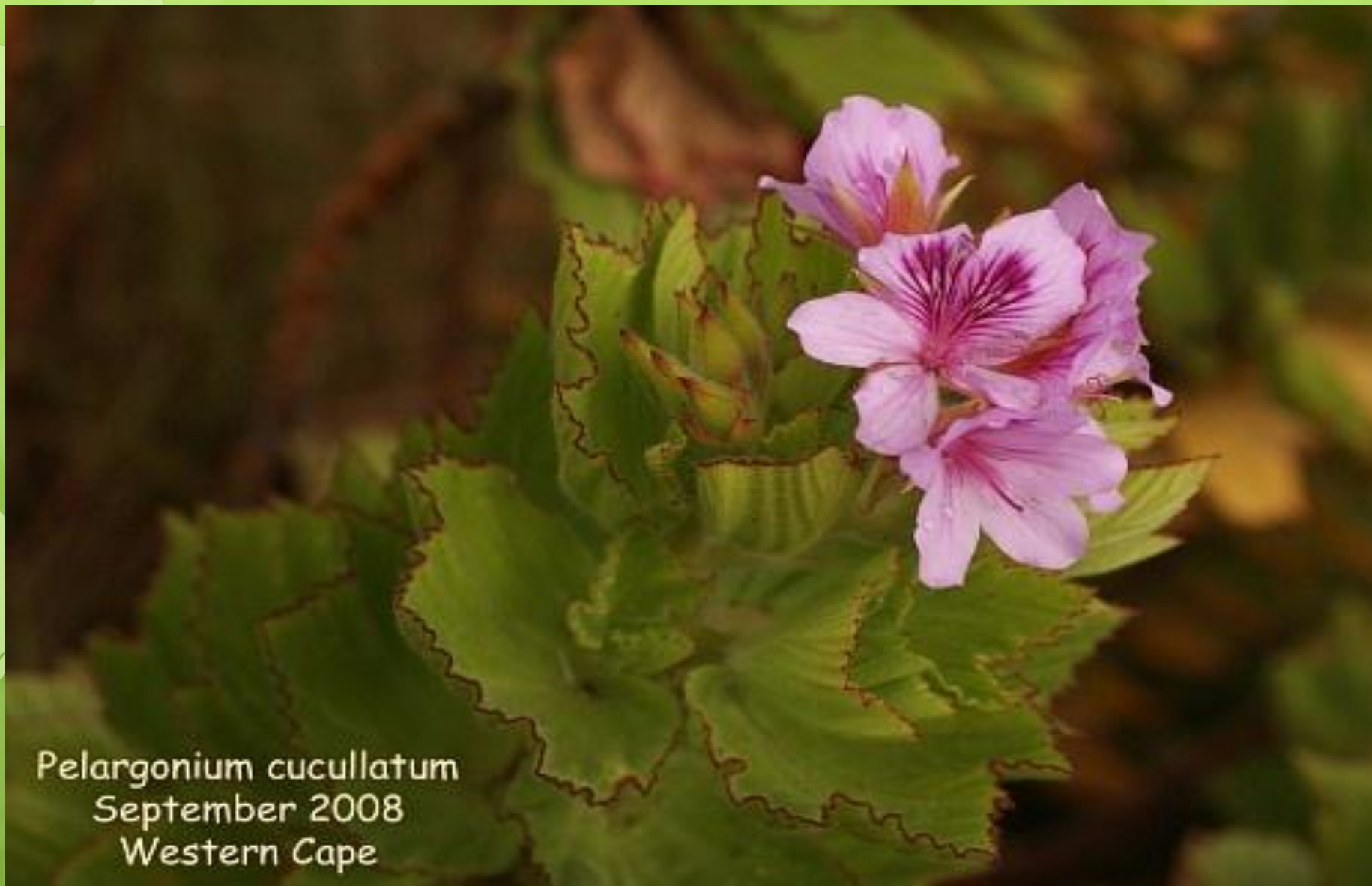
Pelargonium cucullatum September 2008 Western Cape