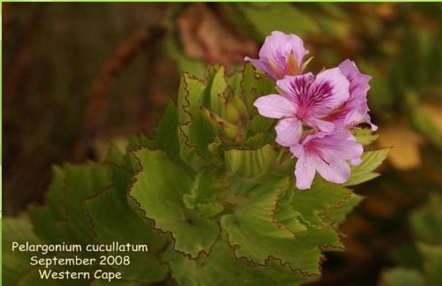
Pelargonium cucullatum September 2008 Western Cape