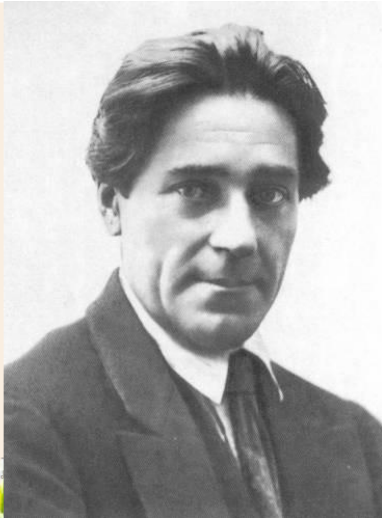
Сергей Антонович Клычков