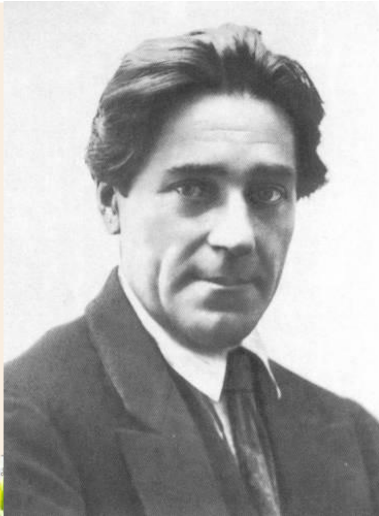
Сергей Антонович Клычков