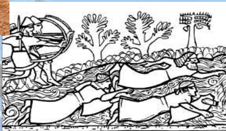
Форсирование реки ассирийскими воинами. Первое известное изображение плавания стилем «кроль»