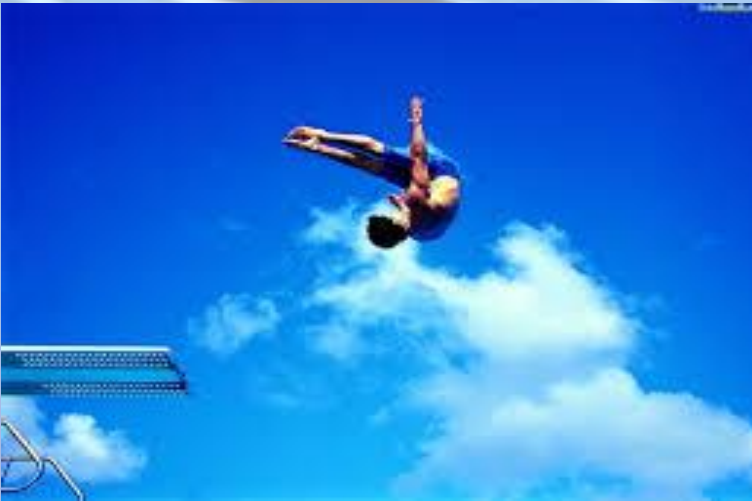
прыжки в воду