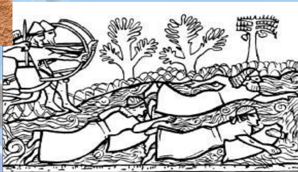
Форсирование реки ассирийскими воинами. Первое известное изображение плавания стилем «кроль»