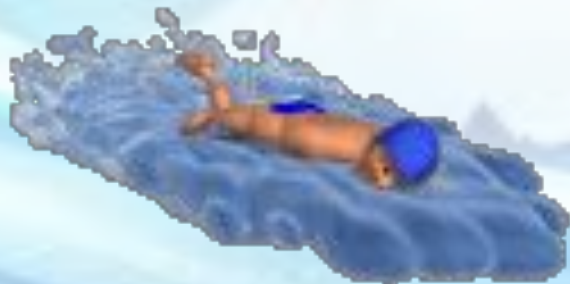
Кроль на груди