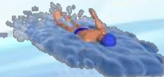
Кроль на спине