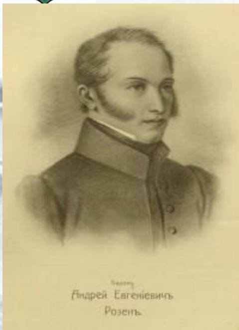
Розен Андрей Евгеньевич Розенъ

Поручик лейб-гвардии Финляндского полка Розен был членом Северного общества декабристов, активно участвовал в подготовке восстания 14 декабря. В день восстания Розен поднял первый батальон своего полка, уже присягнувшего Николаю I, с целью присоединения к восставшим. Осуществить это Розену не удалось. Однако он, задержав своих солдат на Исаакиевском мосту, помешал использованию их для подавления восстания.