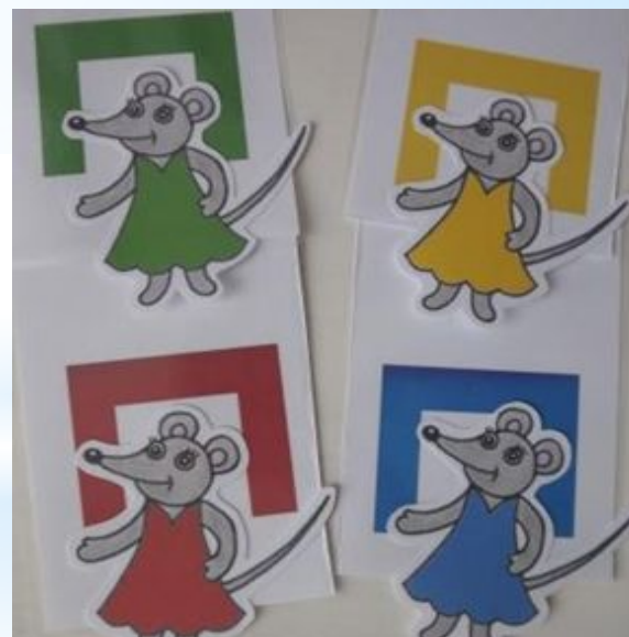
«Найди мышке норку»