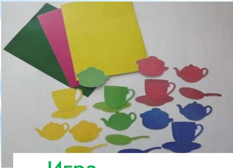
Игра «Собери посуду»