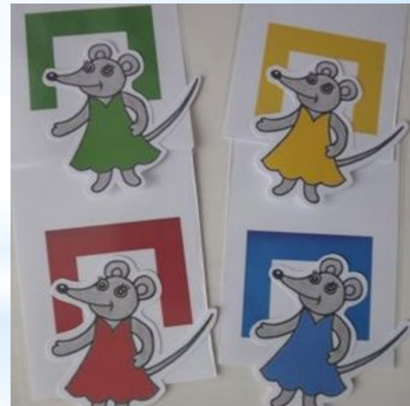
«Найди мышке норку»