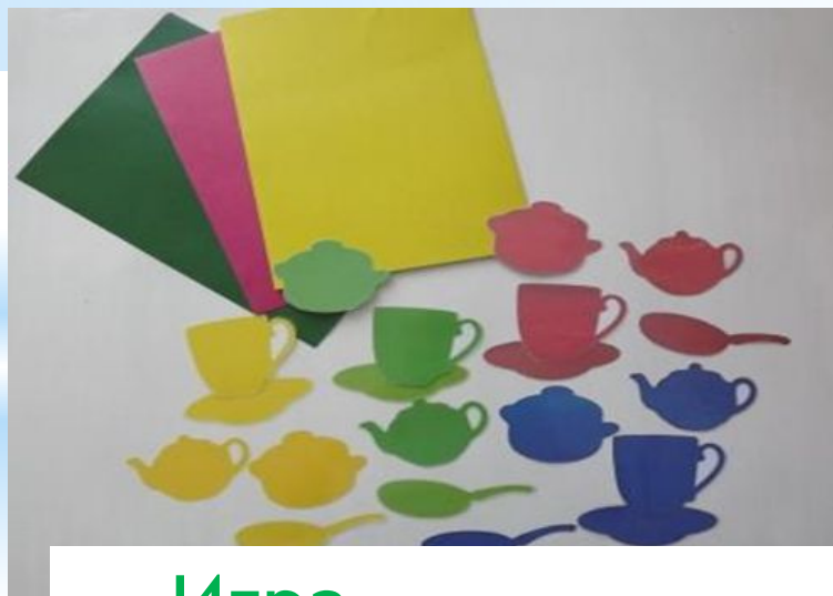
Игра «Собери посуду»