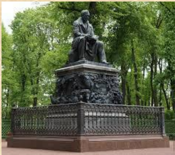
Г. Санкт - Петербург