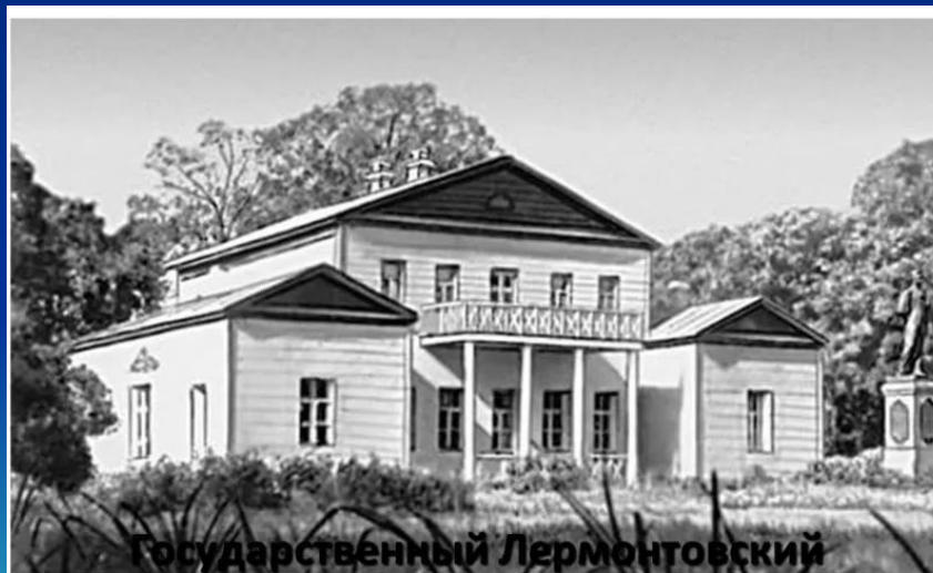
Государственный Лермонтовский музей-заповедник «Тарханы»