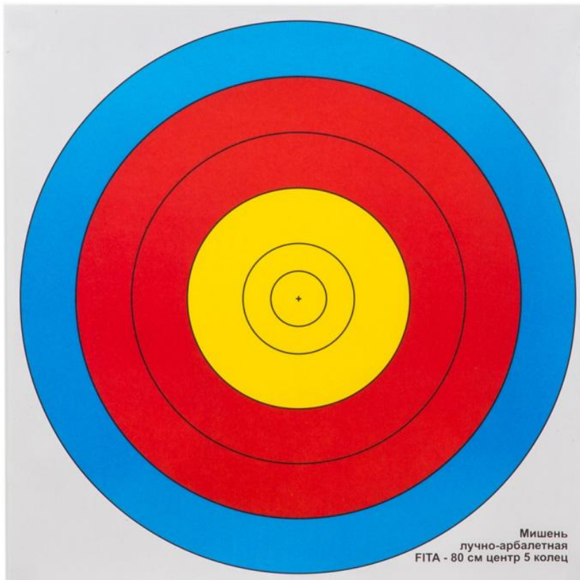
Мишень лучно-арбалетная FITA - 80 см центр 5 колец