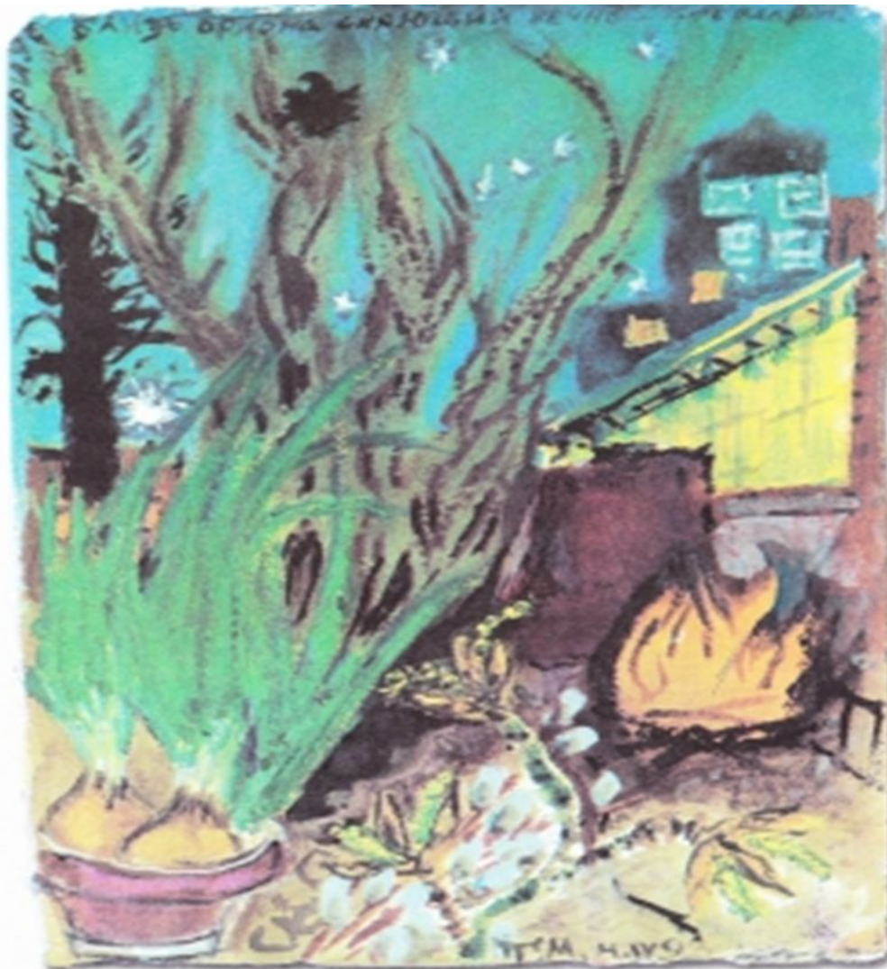
Татьяна МАВРИНА. Костёр во дворе