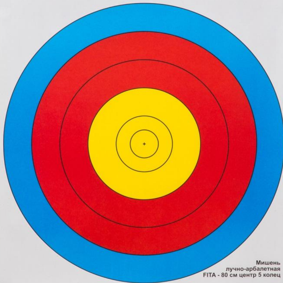
Мишень лучно-арбалетная FITA - 80 см центр 5 колец