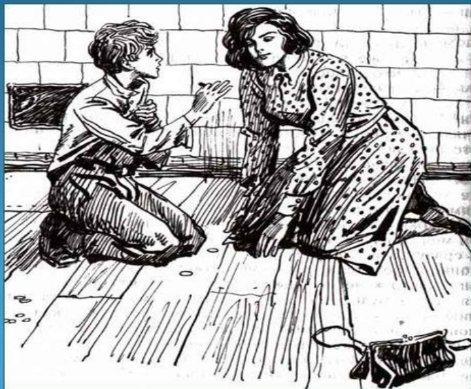
Иллюстрация к рассказу художника И. Пчелко