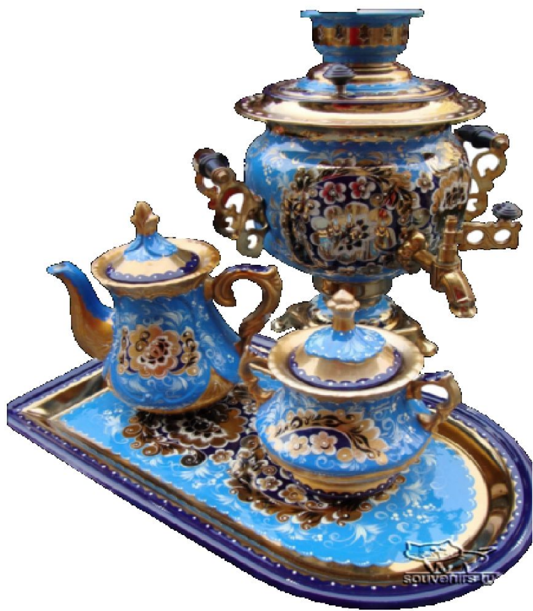
« Золотая Гжель »