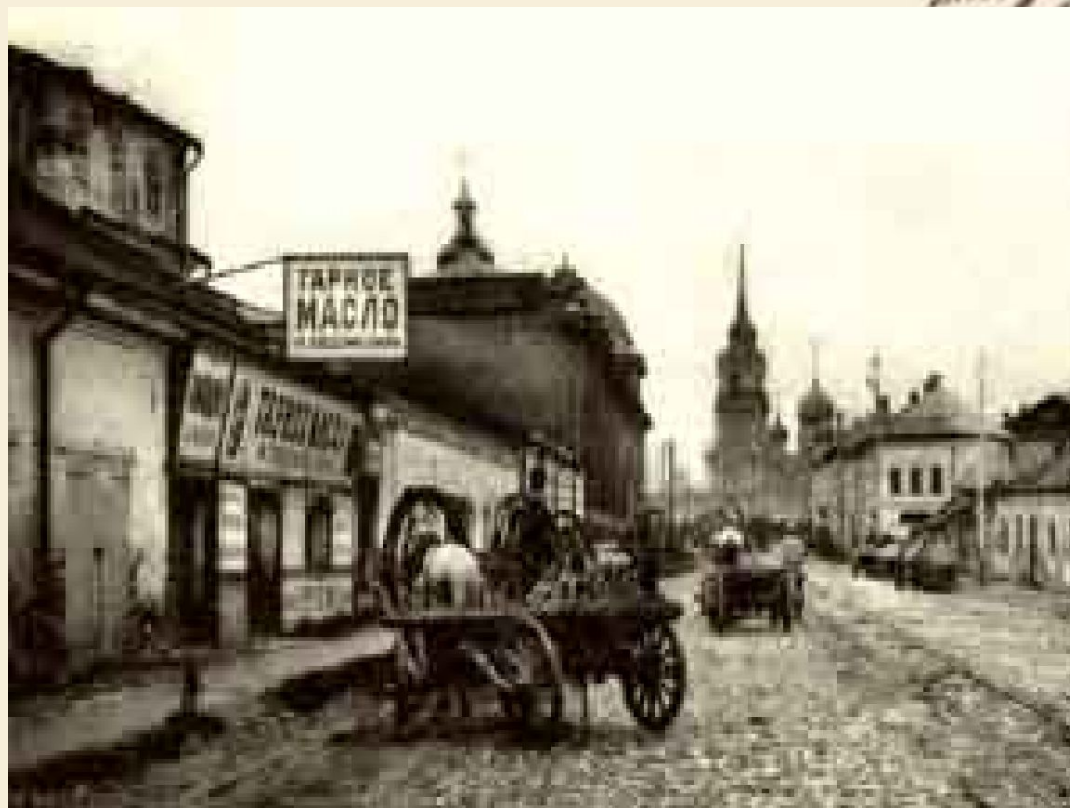
Тула. Воздвиженская улица и Кремль. Фото с открытки начала XX в.