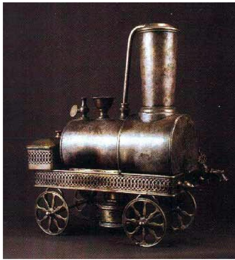
Самовар «Паровоз». XIX в. Латунь, чеканка, серебрение