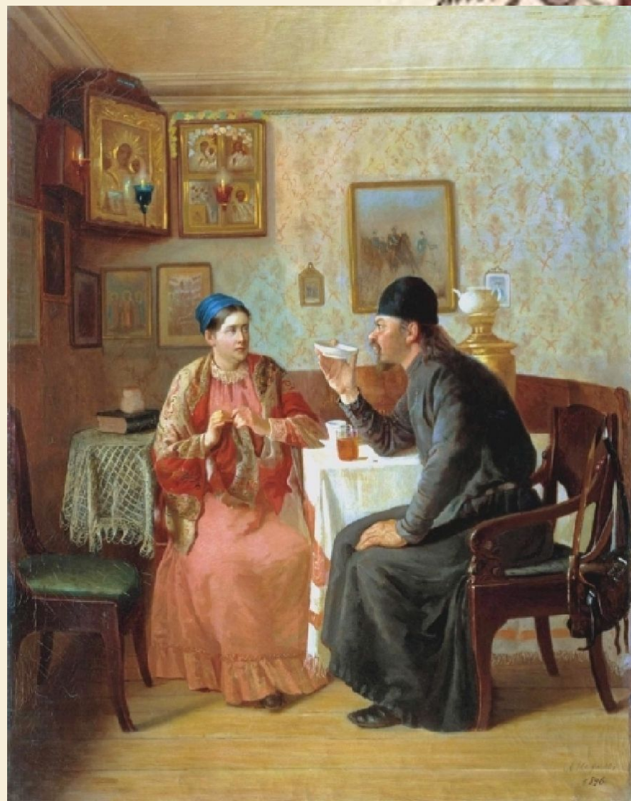
Чаяпитие, Наумов А. А.

И все же прошло еще полвека, прежде чем самовары окончательно утвердились в российских домах — от императора до крестьянина. Случилось это уже после Отечественной войны 1812 года.