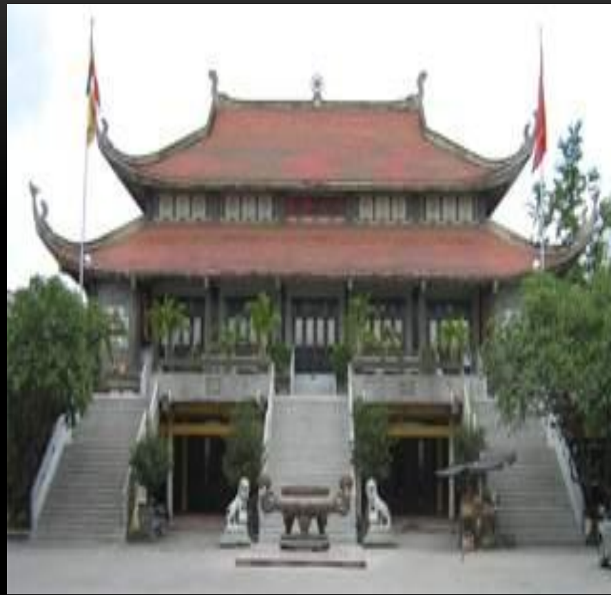
Действующая буддийская пагода в г.Хошимине