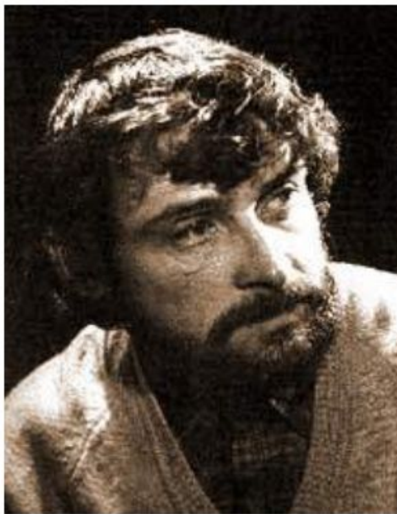
Сергѣй Григорьевич Козлов (22 августа 1939, Москва, СССР — 9 января 2010 года)