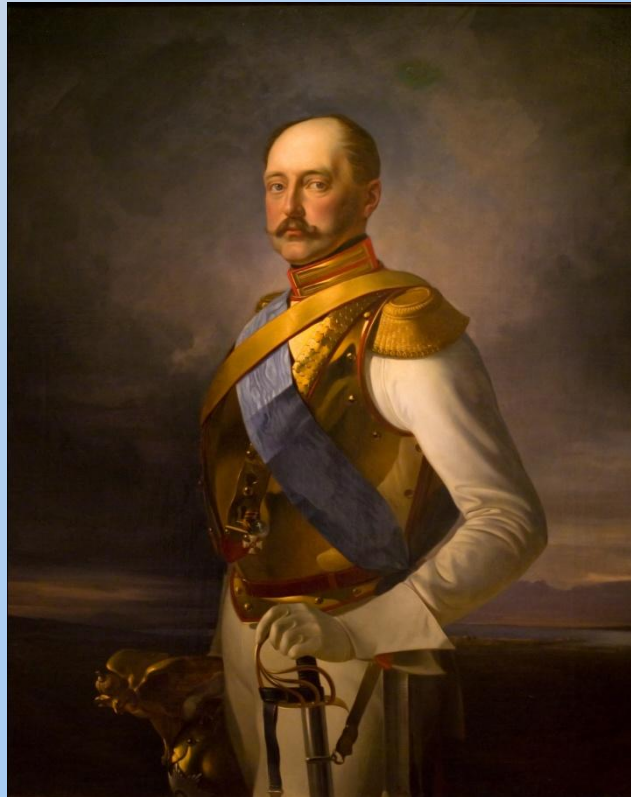
Владимир Сверчков, 1856. Портрет императора Николая Первого