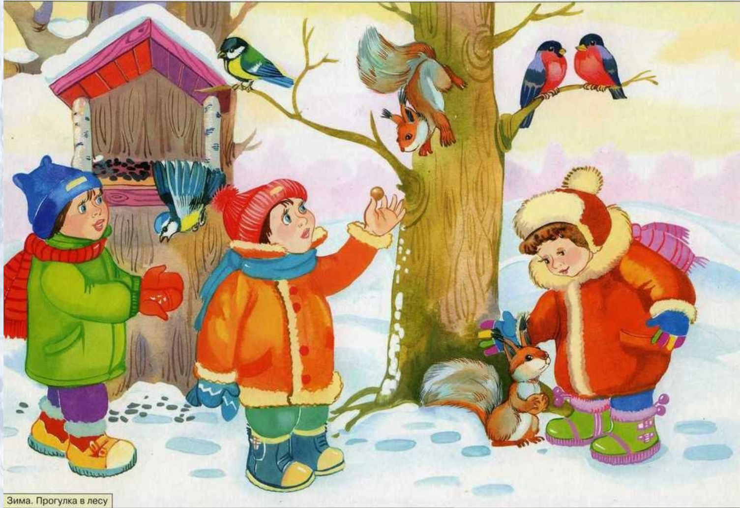
Зима. Прогулка в лесу